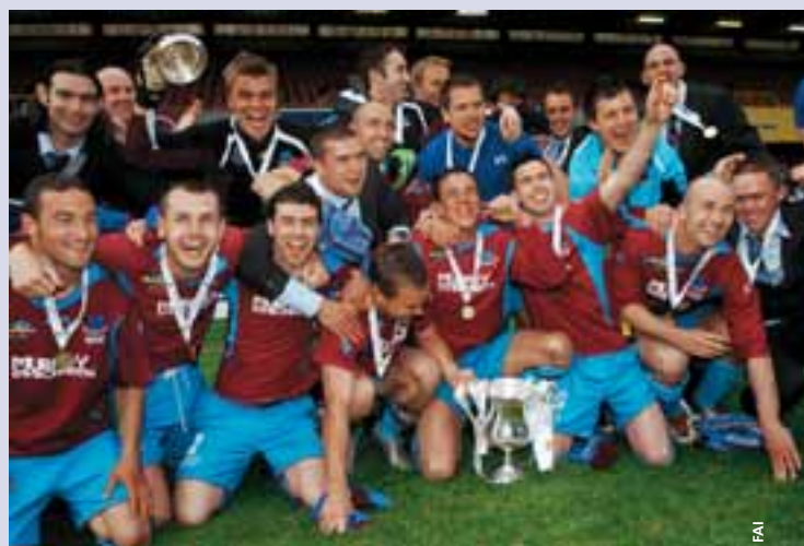
Drogheda United a remporté la Coupe Setanta Sports.

Le FC Drogheda United a obtenu son deuxième titre de rang dans la Coupe Setanta Sports en s'imposant face à Linfield, une équipe de Belfast, après une spectaculaire épreuve de tirs au but; le résultat était nul 1-1 après 90 minutes.