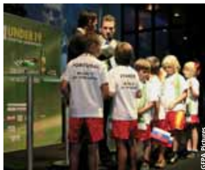
Le tirage au sort du tour final des moins de 19 ans a été opéré à Linz.

Seuls trois des participants étaient déjà présents au tour final de 2006 en