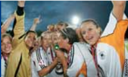
L'Allemagne défendra le titre conquis l'an dernier en Suisse.