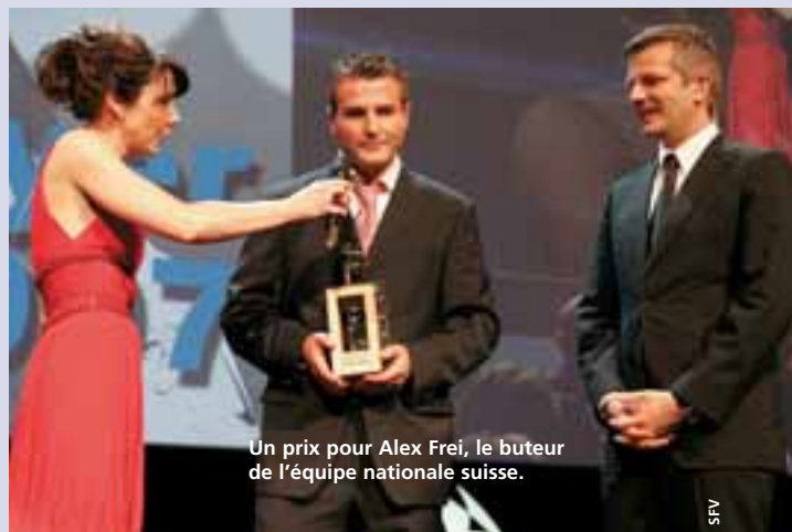
Un prix pour Alex Frei, le buteur de l'équipe nationale suisse.