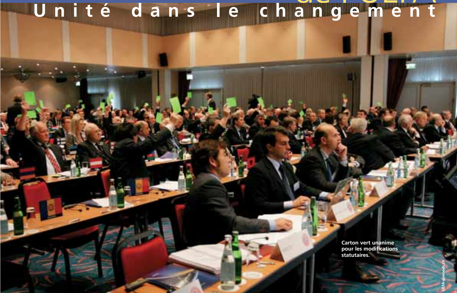
Carton vert unanime pour les modifications statutaires.