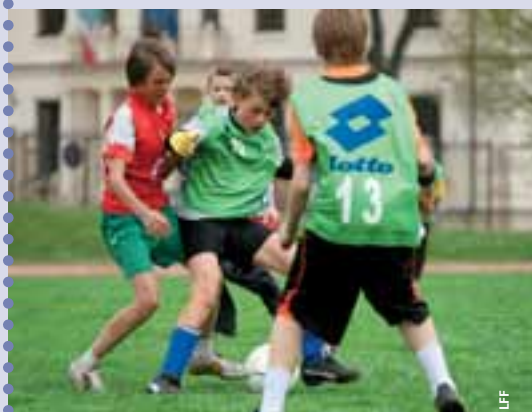
Le tournoi Eziogolas prend des dimensions toujours plus amples.