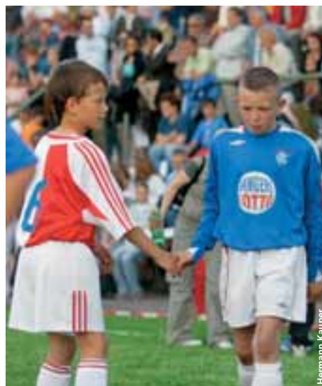
Malgré la déception de la défaite, le fair-play reste de mise.

Les discussions organisées autour du tournoi ont souligné l'importance du travail avec les jeunes et relevé que de tels tournois interculturels étaient un excellent outil pour transmettre, par le jeu, le respect pour l'étranger.