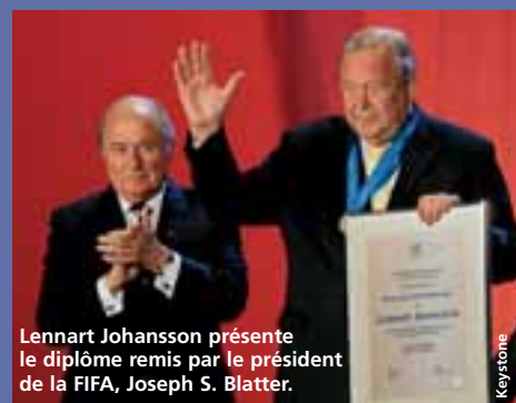
Lennart Johansson présente le diplôme remis par le président de la FIFA, Joseph S. Blatter.

■ Lors du même congrès, le président d'honneur de l'UEFA, Lennart Johansson, a été nommé vice-président d'honneur.