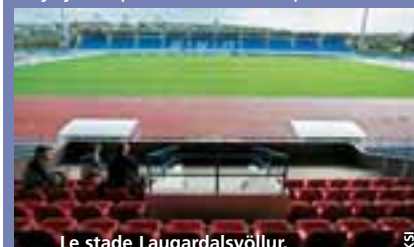
Le stade Laugardalsvöllur.

Le FC Fram dispute depuis des années ses matches à domicile au stade Laugardalsvöllur , qui a également accueilli quelques autres équipes de Reykjavik pour de courtes périodes.