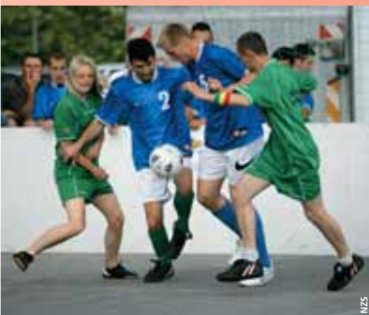
Des rencontres pour mettre en vitrine des footballeurs «différents».