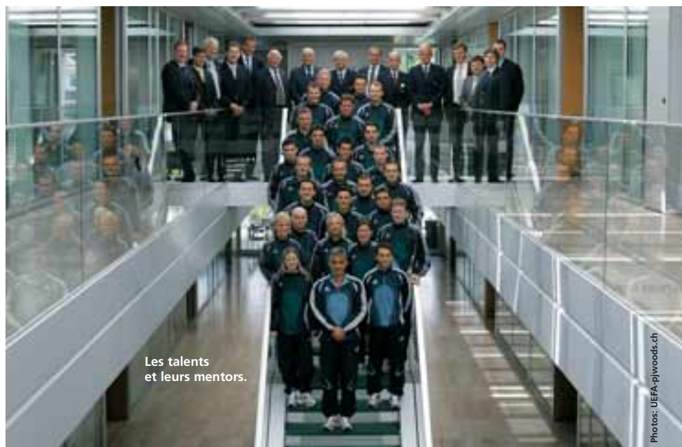
Les talents et leurs mentors.