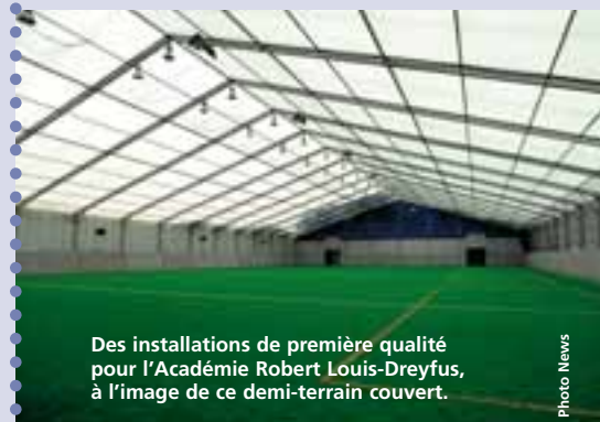
Des installations de première qualité pour l'Académie Robert Louis-Dreyfus, à l'image de ce demi-terrain couvert.