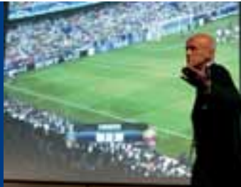
Analyse sur grand écran avec Pierluigi Collina.