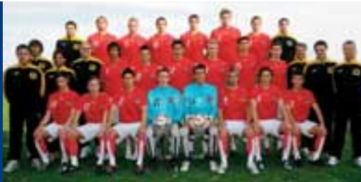
L'équipe autrichienne des M19 tentera de faire mieux que sa demi-finale de 2006.