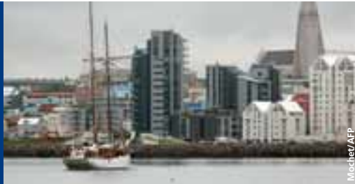
Reykjavik, capitale de l'Islande.