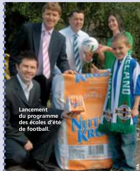
Lancement du programme des écoles d'été de football.

Le programme des écoles de football d'été a été présenté récemment après le lancement d'un nouveau partenariat entre le département de football de base de l'IFA et la boulangerie industrielle Irwin's. →