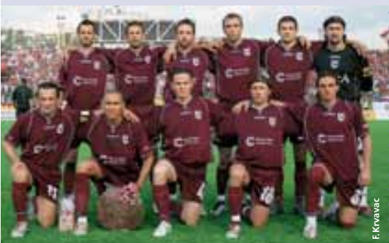
Le champion, le FK Sarajevo.

Les femmes ont également disputé la finale de la coupe au Stade Grbavica de Sarajevo. Le vainqueur a été le SFK 2000 de Sarajevo qui a battu ZFK Borac de Banja Luka.