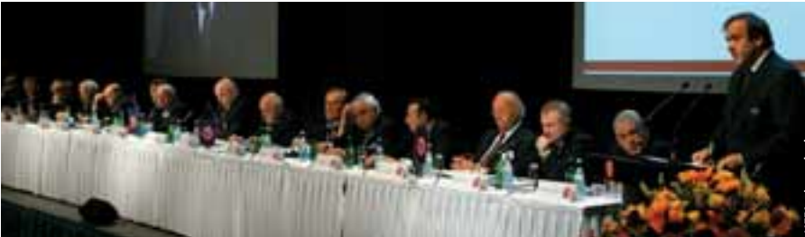
La table du comité exécutif au Congrès extraordinaire de Zurich.