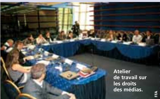
Atelier de travail sur les droits des médias.

La finale de la Coupe d'Arménie s'est d'autre part jouée le 9 mai au stade Republic d'Erevan entre le FC Banants et le FC Ararat et a constitué un magnifique lever de rideau. Les deux équipes n'avaient plus remporté la trophée de cristal depuis les années 1990 (Ararat en 1993, 1994, 1995 et 1997, Banants ne l'ayant remporté qu'une seule fois, en 1992). Aussi avaient-elles soif de victoire.