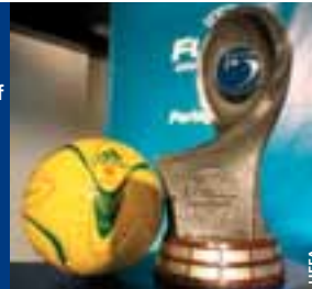
Le trophée du Championnat d'Europe de futsal et le ballon officiel.