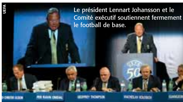
Le président Lennart Johansson et le Comité exécutif soutiennent fermement le football de base.

Lennart Johansson a remercié les 52 associations membres représentées à Chypre de leur soutien et leur travail dans le domaine du football de base.