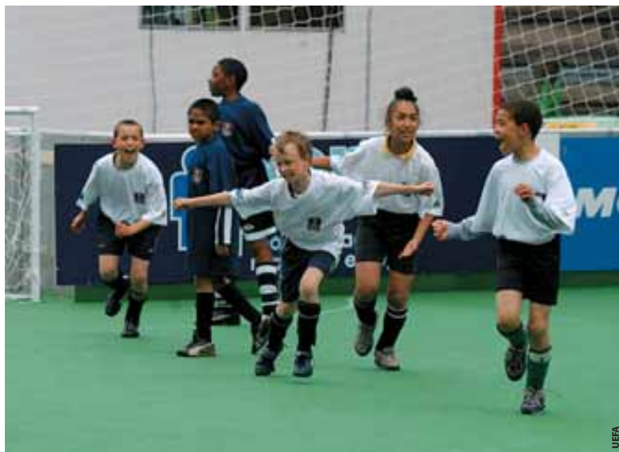
«Starball», un tournoi de football de base joué avant la finale de la Ligue des champions de l'UEFA.