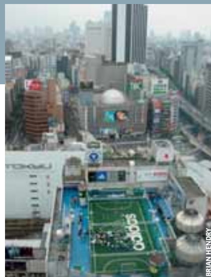
Le football de base peut se pratiquer partout... même sur un toit.