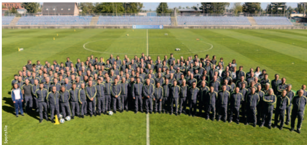
Composition de la commission au 30 juin 2016