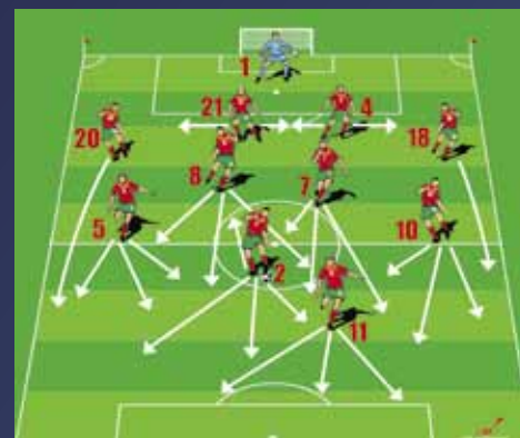
Belarus - Danemark