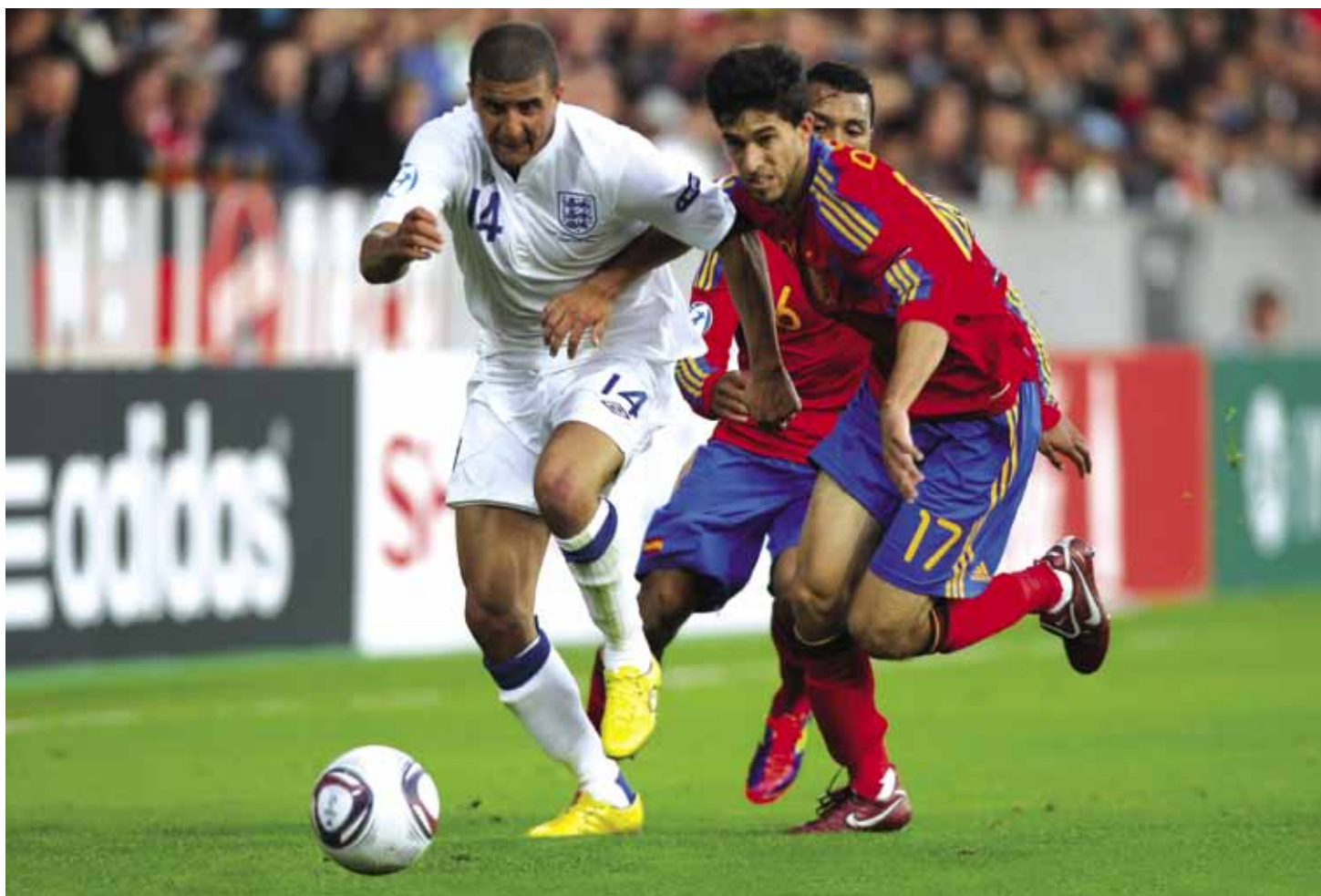
Deux des arrières latéraux les plus impressionnants du tournoi, le numéro 14 anglais Kyle Walker et l'arrière gauche espagnol Didac Vilà, luttent pour la possession du ballon lors du match nul 1-1 à Herning.