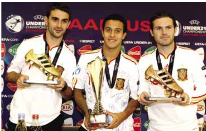
Après la finale, l'Espagne a fait main basse sur les prix, avec le Soulier d'or attribué à l'attaquant Adrián López, la distinction d'Homme du match décernée à Thiago Alcántara, et le trophée du Soulier de bronze du tournoi remis à Juan Mata.