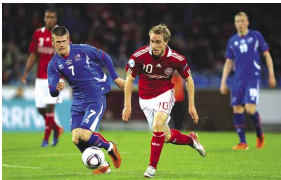
Le créatif Danois Christian Eriksen est poursuivi par l'Islandais Johann Gudmundsson dans le match décisif du groupe A à Aalborg.