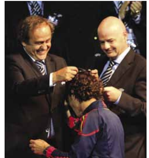
Luis Milla reçoit sa médaille d'or des mains du Président de l'UEFA, Michel Platini, en présence du secrétaire général, Gianni Infantino.

Toutefois, son parcours de 16 années en tant que joueur l'a mis dans une position plus que confortable. Son CV est exceptionnel: le FC Barcelone, Real Madrid et Valence y figurent en bonne place; et il a eu le privilège de travailler avec des entraîneurs tels que Johan Cruyff, Alfredo di Stéfano, Radomir Antic, Leo Beenhakker, Vicente Del Bosque, Fabio Capello, Claudio Ranieri et Héctor Cúper. En rejoignant la RFEF, sa priorité a été d'appliquer ses connaissances aux philosophies de