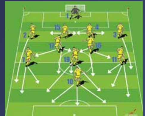
Ukraine - Espagne