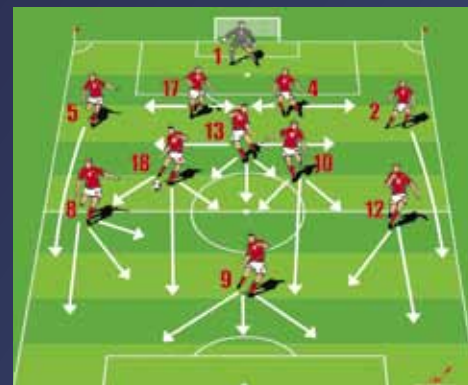
République tchèque - Angleterre