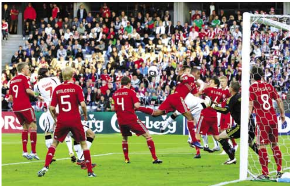
L'inquiétude se lit sur les visages dans une surface de réparation danoise bondée, lors de la victoire 2-1 de l'équipe hôte face au Belarus, qui sera aussi sa seule victoire du tournoi.

Le Belarus ne semblait plus faire partie de l'équation alors qu'il était mené par la Suisse 0-2 à la mi-temps, à Aarhus. Mais, juste avant l'heure de jeu, des nouvelles parvinrent d'Aalborg selon lesquelles deux buts islandais avaient été inscrits en deux minutes. Ce score a donné le signal d'une fin de match complètement folle où l'on a assisté à 43 tentatives de but. Faisant fi de toute prudence, les Danois sont parvenus à réduire la marque à 2-1 à la 81 e minute – à un but de la qualification –, mais tous leurs espoirs ont été réduits à néant par un troisième but islandais à la deuxième minute du temps additionnel. Le score final de 3-1 n'a pas seulement éliminé le pays organisateur, mais a refroidi la joie des