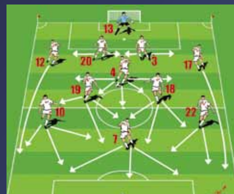
Espagne - Suisse