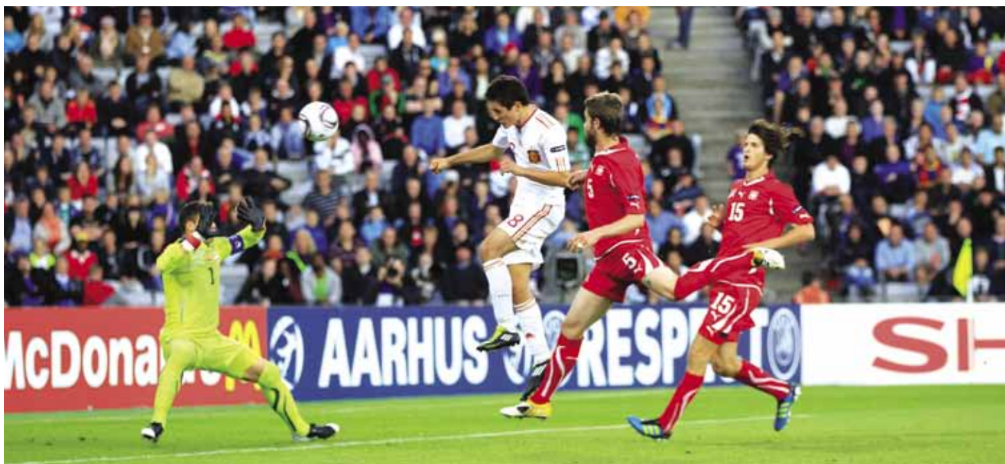
Le milieu espagnol Ander Herrera reprend un excellent centre de l'arrière gauche Didac Vilà et permet à son équipe d'ouvrir le score dans la finale.