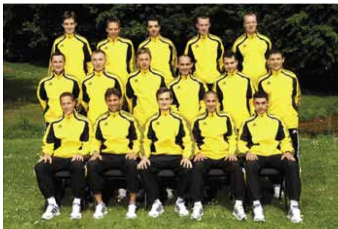
Les seize officiels de match, provenant de seize pays, qui ont dirigé les matches du tournoi au Danemark.