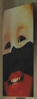
Portrait of a woman