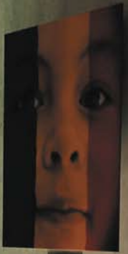
Portrait of a woman