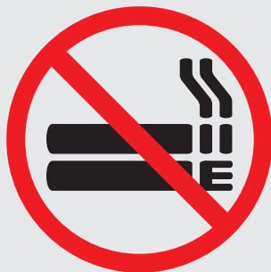
Exemple de signalétique principale incluant les cigarettes électroniques:

le tabac et les cigarettes électroniques sont interdits dans l'enceinte du stade.