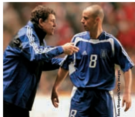
Otto Rehhagel, vainqueur de l'EURO 2004 et l'un des cinq entraîneurs qui auront participé aux deux derniers tours finals du Championnat d'Europe.

Sans l'aide de la boule de cristal, il est difficile de prédire qui remportera la récompense suprême du football international européen le 29 juin 2008. L'efficacité devant le but jouera certainement un rôle clé et les exploits signés lors du tour qualificatif par le Croate Eduardo (10 buts pour 12 frappes), le Polonais Smolarek (9 buts pour 15 frappes), l'Allemand Podolski (8 buts pour 14 frappes) et le Portugais Ronaldo (8 buts pour 31 frappes) laissent bien augurer des perspectives s'offrant à leurs équipes. Mais, à n'en pas douter, le sens de la conduite des hommes et l'habileté tactique des seize entraîneurs, sans oublier la qualité et la condition physique de leurs joueurs, auront un impact important sur l'issue d'une manifestation qui attirera un public énorme dans le monde entier. Il ne fait pas de doute que la chance jouera un rôle, et au cours de l'événement, certains chercheront les ombres de la superstition pour un indéfinissable soutien. Mais, pour la plupart d'entre nous, la lecture du jeu sera bien plus importante que de lire quelque chose dans un chiffre – fût-ce le numéro 13.