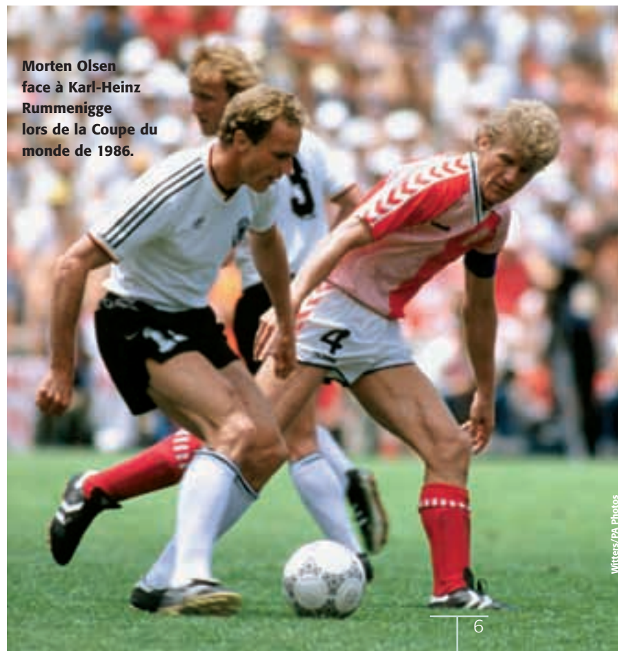
Morten Olsen face à Karl-Heinz Rummenigge lors de la Coupe du monde de 1986.

Le jeu est manifestement devenu plus rapide et plus compact et cela signifie qu'il faut avoir une meilleure technique et une aptitude à lire plus rapidement le jeu. De nos jours, les joueurs n'ont pas l'espace dont nous disposions. Mais je suis sûr que les joueurs les plus talentueux de mon époque s'adaptent aux conditions d'aujourd'hui. Un autre facteur qui a influencé la qualité du football moderne est la qualité