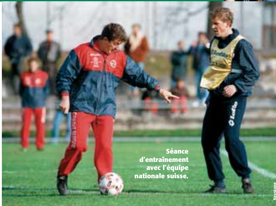
Séance d'entraînement avec l'équipe nationale suisse.

nécessaire d'avoir l'esprit ouvert et de ne pas mépriser des choses qui sont partie intégrante de la culture d'un pays. Dans un nouvel environnement, vous devez souvent travailler même encore plus durement sur les nouvelles relations – cela concerne les médias, le public, les directeurs. L'aspect du jeu est souvent la partie la plus aisée parce que le football est une langue universelle et les joueurs vont rapidement se rendre compte si l'entraîneur est bon ou non. Les joueurs pardonneront les problèmes liés aux capacités et à la manière de communiquer s'ils pensent que vous connaissez votre matière.