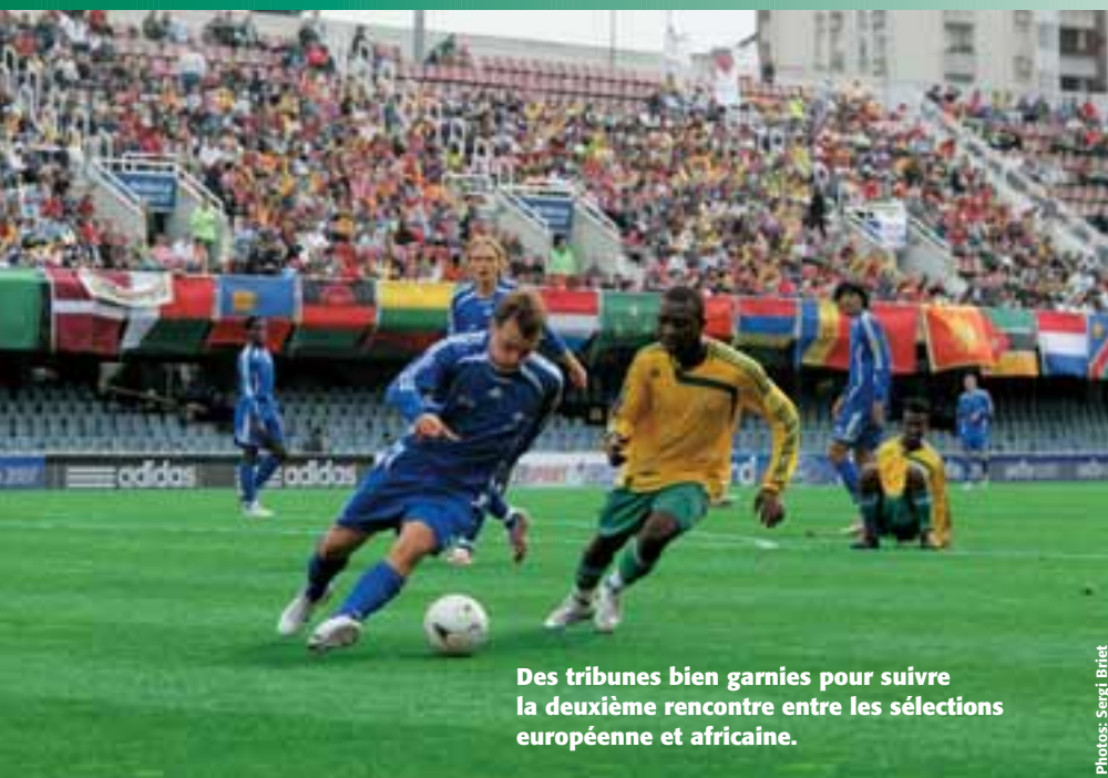
Des tribunes bien garnies pour suivre la deuxième rencontre entre les sélections européenne et africaine.