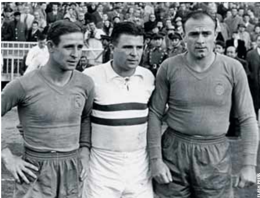
Ferenc Puskas, sous le maillot de l'équipe nationale hongroise, entre ses coéquipiers de Real Madrid Raymond Kopa et Alfredo Di Stefano.

A l'heure où le football bénéficie d'une couverture télévisée totale, l'impact de joueurs vedettes tels que Cristiano Ronaldo ou Kaka, ne saurait être trop souligné. L'élite, qu'il s'agisse des joueurs, des entraîneurs ou des formateurs, ne saura jamais l'effet qu'elle a sur ceux qui ont les yeux rivés sur elle mais elle doit être consciente de l'influence qu'elle a et de ses responsabilités. Ferenc Puskas, avec sa modestie, son humour et son génie, n'a pas seulement collectionné les coupes et les médailles mais, chose encore plus importante, il a gagné les cœurs et les esprits d'innombrables supporters et jeunes footballeurs ambitieux. Dorénavant, avec l'inauguration de l'école de football portant son nom, le pouvoir de Puskas perdure. Dans un monde du football où les salaires et les sommes de transferts ont pris l'ascenseur, ceux qui ont l'aura et la capacité d'inspirer la prochaine génération constituent d'incalculables trésors.