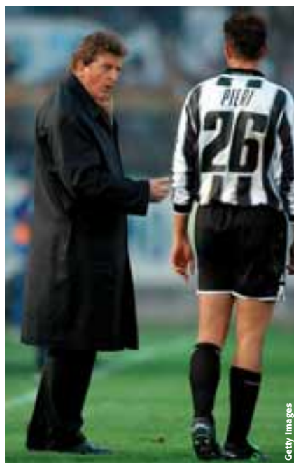
Après son passage à l'Internazionale de Milan, Roy Hodgson a fait une autre expérience italienne avec Udinese.

Dans les tours de qualification et la phase finale, la tâche consiste à signer des performances régulières de telle manière que l'entraîneur sache que son équipe ne va pas le décevoir. Il faut travailler très durement afin d'éviter les extrêmes – par exemple, le mois passé, l'équipe était homogène et maintenant elle va dans tous les sens. C'est particulièrement important quand on travaille avec une équipe nationale où les résultats créent soit l'euphorie soit le désastre et ont des conséquences pour le moral des joueurs et les attentes du public. En tant qu'entraîneur d'une équipe nationale, vous devez éviter les extrêmes, n'être ni euphorique en raison d'un bon résultat ni pessimiste après une défaite. Quand vous participez à un tour final, vous devez être conscient de ce que cela va représenter pour les joueurs d'être pleinement concentrés pendant la durée de la manifestation. Ils sont aussi ensemble à l'étranger dans un environnement différent, parfois dans une atmosphère de claustrophobie. D'ordinaire, les Italiens sont en mesure de mieux maîtriser ce phénomène