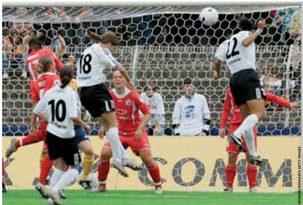
Les joueuses ont aussi leur compétition interclubs européenne. La finale de 2006 a opposé deux clubs allemands, FFC Francfort et FFC Turbine Potsdam.

Au moment où nous accueillons les moins de 17 ans au sein de notre famille du football, nous sommes en droit d'avoir l'impression que de solides structures internationales sont en place. Nous devons maintenant être certains de bâtir judicieusement sur ces structures, d'une manière qui permettra aux standards du football féminin de rester sur la courbe ascendante.