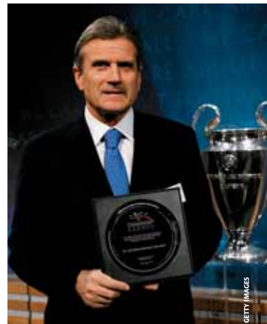
Giacinto Facchetti avait reçu de l'UEFA une plaquette destinée aux joueurs qui ont fait l'histoire de la Coupe/Ligue des champions de l'UEFA.