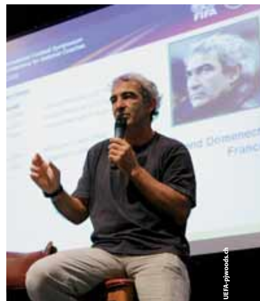
Raymond Domenech fait l'éloge des vétérans.

Cette question a été débattue soigneusement après un commentaire de Carlos Alberto Parreira, dont l'équipe brésilienne s'est produite devant des foules de 4000 spectateurs ou plus lors de chaque séance d'entraînement du camp de préparation en Suisse