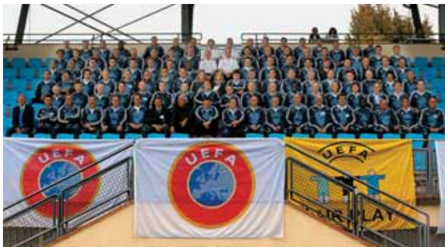
Les participants du cours de Coverciano.