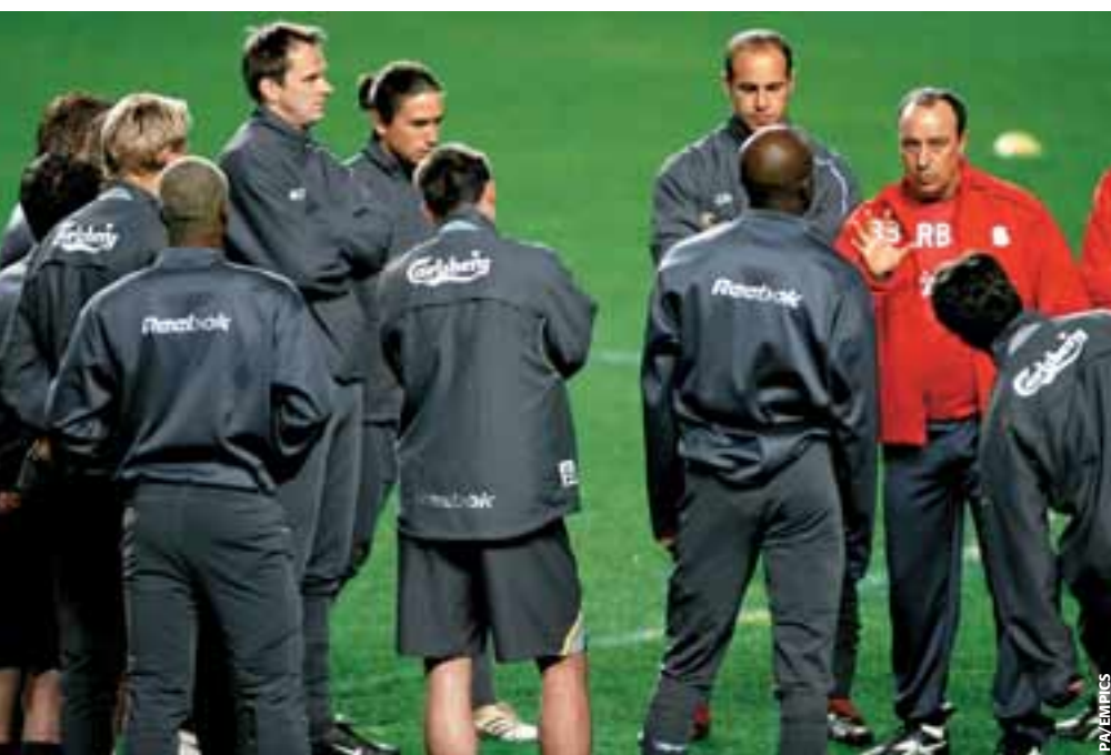
Rafael Benitez au milieu des joueurs de Liverpool.

Les avantages de cet extranet sont de fournir à l'entraîneur pressé par le temps une simple référence informatique directe. L'extranet a beaucoup plus de