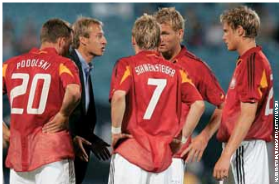
Jürgen Klinsmann donne ses consignes aux internationaux allemands.

Ma priorité est de faire en sorte que «l'équipe derrière l'équipe» travaille de concert afin de trouver la bonne chimie au sein du contingent. S'assurer que la condition physique est bonne et que