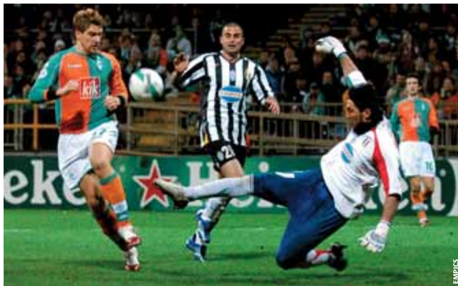
L'arbitre doit être bien placé pour juger les duels entre gardien et attaquant.

Les techniciens ont souligné que les moments qui suivent le changement de possession de la balle d'une équipe à une autre étaient les éléments clés de la structure du jeu moderne. Les situations où l'équipe qui prend possession de la balle tente de contre-attaquer rapidement et efficacement alors que l'équipe qui a perdu le contrôle de la balle a pour objectif de mettre immédiatement un terme à cette contre-attaque génèrent une série de défis pour l'arbitre et ses assistants. Pour eux, les transitions rapides demandent également des réponses rapides en termes de capacité à suivre la progression du jeu afin de juger des situations et des sanctions avec autant d'efficacité que possible.