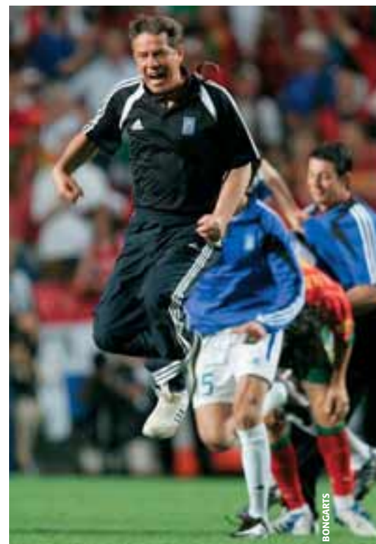
Otto Rehhagel exulte après la victoire de la Grèce sur le Portugal en finale de l'EURO 2004.

du football – joueurs, entraîneurs, arbitres, clubs, administration et supporters. La qualité dépend de la profondeur. Il n'est pas suffisant d'avoir quelques clubs d'élite qui dominent la scène. Nous avons besoin de la variété et de l'intensité de la concurrence. Pensons simplement aux efforts inlassables de Valence en 2000 et 2001 – à deux reprises ce club a été le dauphin de la Ligue des champions mais n'a jamais obtenu le sacre! Ou à la «valeur ajoutée» qu'Arsène Wenger et Arsenal ont donnée à la Ligue des champions sans la remporter (jusqu'ici). Oui, tout, dans le football, résulte des compétitions. Pendant les 50 dernières années, les compétitions de l'UEFA pour les clubs d'élite et les équipes nationales ont créé une vitrine pour ce qu'il y a de mieux dans le football européen et il est essentiel pour la santé future du jeu sur notre continent que nous reconnaissons, défendons et développons les compétitions phares de l'UEFA – la Ligue des champions de l'UEFA et le Championnat d'Europe. Après tout, elles sont notre activité principale et notre inestimable héritage.