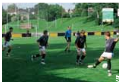
Douze juniors travaillent actuellement au centre de formation d'Emmen sous la direction de trois entraîneurs de l'ASF.