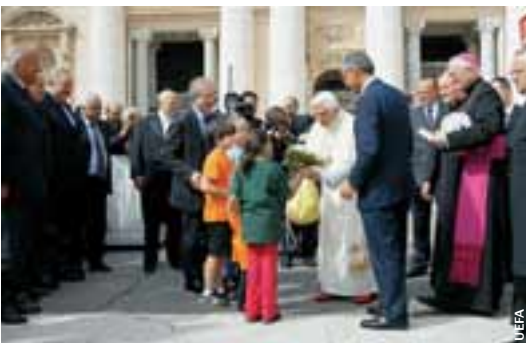
Une délégation des enfants du projet «Calcio Cares» a été reçue par Benoît XVI, en présence des membres du Comité exécutif de l'UEFA.