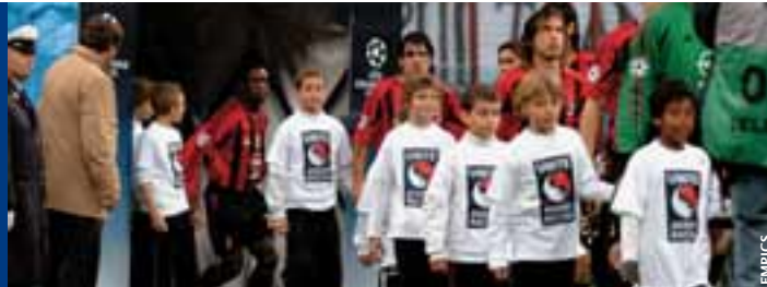
Le nouveau manuel pour la licence veut aussi contribuer à lutter contre le racisme.

« Avec l'expérience, on arrive à sentir ce qui n'est pas encore arrivé. Après 10 à 15 minutes, l'arbitre devrait être capable de voir comment elle va gérer le match. »