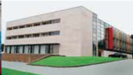
Le stade et le centre de Mogosoia.