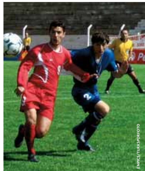
Une journée de repos de plus dans les minitournois juniors.

Les nouvelles dispositions adoptées à Rome entreront en vigueur dès la saison 2008-09. Toutefois, comme l'année fiscale 2006-07 (ou 2007 pour ceux qui jouent selon un calendrier printemps-automne) sera décisive en ce qui concerne les