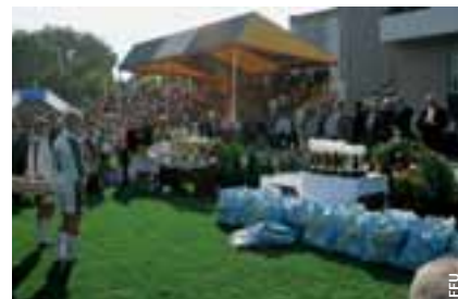
Distribution des prix à la fête des Jeux ruraux.