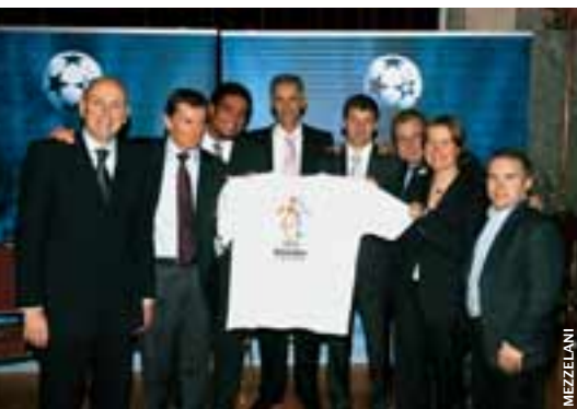
Les représentants des associations pilotes et de la division du développement du football de l'UEFA à la cérémonie de signature à Rome.

exécutif en décembre 2004 et, le 20 septembre à Rome, les cinq associations nationales pilotes d'Allemagne, Angleterre, Ecosse, Norvège et Pays-Bas ont obtenu la reconnaissance par l'UEFA de leurs programmes en faveur du football de base.