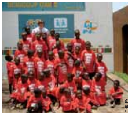
Les jeunes orphelins maliens aux couleurs de la FA.