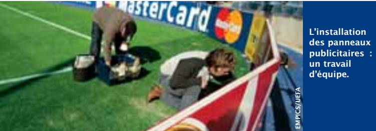
L'installation des panneaux publicitaires : un travail d'équipe.