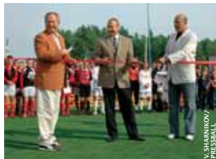
Inauguration du miniterrain.

Le 8 septembre a eu lieu l'inauguration d'un miniterrain, installé grâce à l'aide de l'UEFA, de la société PUMA et de la Fédération de football de Belarus (BFF).