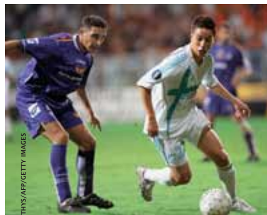
Olympique de Marseille (Samir Nasir, en blanc), l'une des deux équipes françaises (avec Lens) venues cette saison de la Coupe UEFA Intertoto.

La nouvelle formule entrera en vigueur dès la saison prochaine.