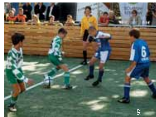
Les miniterrains rencontrent un beau succès.

Le projet de miniterrains se déroule bien. A ce jour, les enfants de 38 villes bénéficient de ces terrains en pelouse artificielle et d'ici 2010, une centaine de miniterrains devraient être construits. Le premier a été inauguré en septembre 2004; depuis lors 43 miniterrains ont été réalisés et il devrait y en avoir 68 d'ici la fin de 2005.