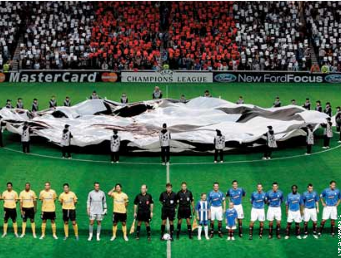
Avant le coup d'envoi, un cérémonial bien établi.

au niveau mondial. Nous avons introduit un format de jeu identique dans toute l'Europe, à commencer par un coup d'envoi unique, à 20 h 45. La cérémonie est similaire dans tous les stades: le drapeau, l'hymne, les publicités, la retransmission. UEFA, TEAM, partenaires, tous nous travaillons dans le même but: offrir un produit de qualité.