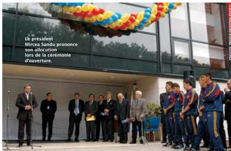
Le président Mircea Sandu prononce son allocution lors de la cérémonie d'ouverture.