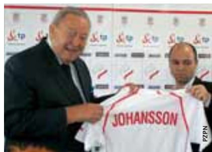
Le président de l'UEFA Lennart Johansson, hôte d'honneur du tournoi pour les enfants.

Ayant accepté une invitation spéciale de la Fédération polonaise de football (PZPN), le président de l'UEFA, Lennart Johansson, s'est rendu en Pologne en septembre en