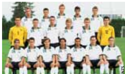
Les moins de 19 ans ont atteint leur objectif.

Comme chaque automne, un grand nombre d'activités est organisé par l'Association slovène de football. Relevons parmi elles la compétition de qualification pour le Championnat d'Europe des moins de 19 ans 2006.