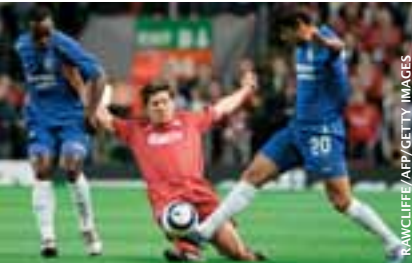
Le cas de Liverpool, cette année, va entraîner une modification du règlement de la Ligue des champions dans le but d'assurer la participation du détenteur du trophée.