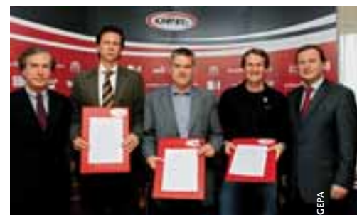
Les premiers entraîneurs individuels et leurs contrats.