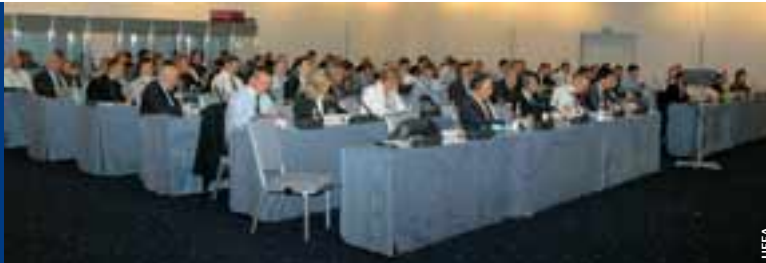
Les 19 et 20 septembre à Genève, un séminaire FIFA-UEFA sur les statuts de la FIFA a réuni les représentants des associations nationales.