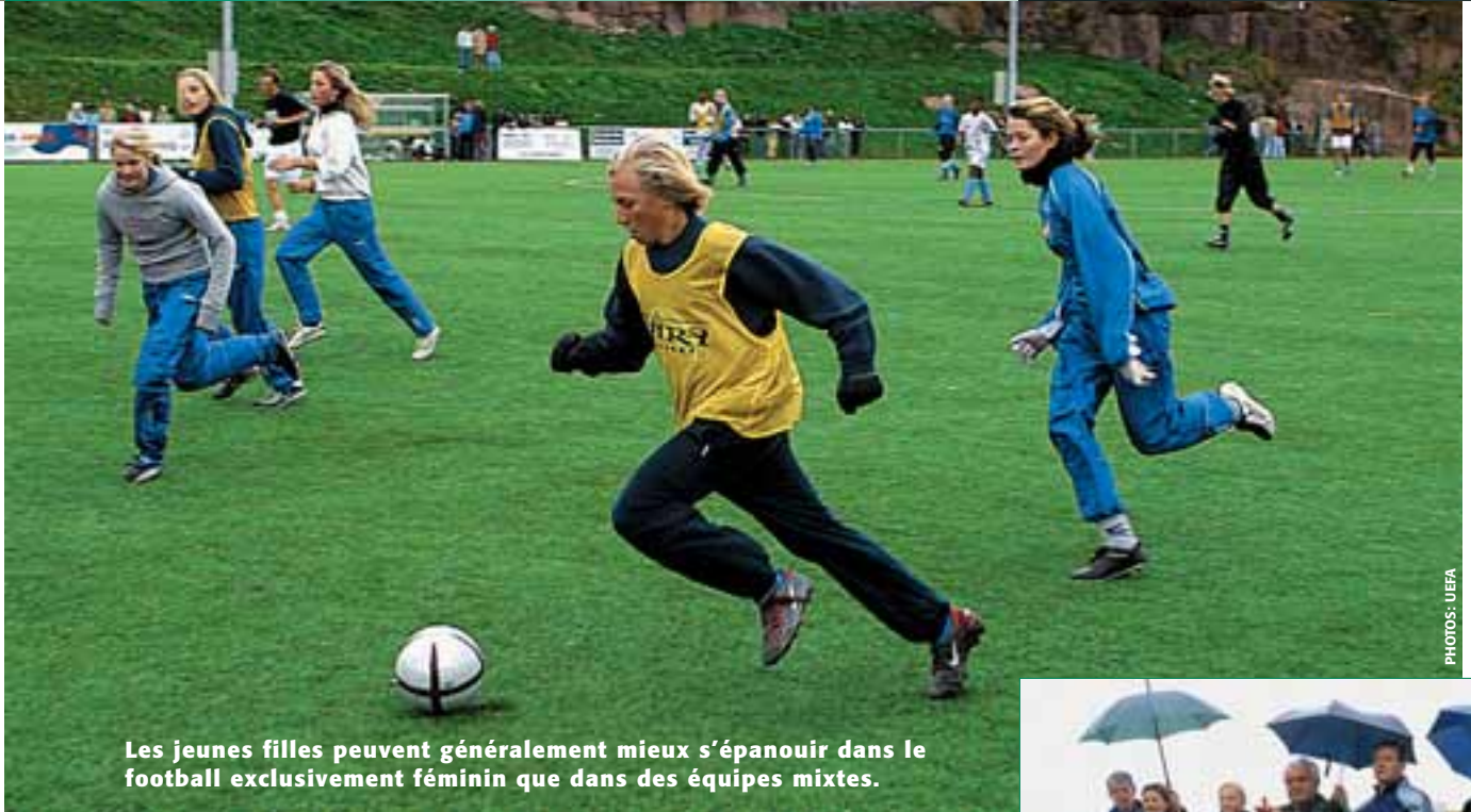
Les jeunes filles peuvent généralement mieux s'épanouir dans le football exclusivement féminin que dans des équipes mixtes.