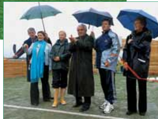
Andy Roxburgh abrite le vice-président de l'UEFA Per Ravn Omdal lors de l'inauguration d'un miniterrain.

Piet Hubers a expliqué comment les bases du coaching sont jetées aux Pays-Bas par le biais de réunions et de cours organisés au début de chaque saison. Un cours type se compose de quatre séances de trois heures destinées à des parents qui sont des entraîneurs juniors potentiels. Le contenu est un mélange de théorie et de pratique et chaque participant repart avec un kit de base qui comprend des informations de fond sous la forme d'un livre et d'un CD-Rom. Ces cours sont donnés par 50 entraîneurs régionaux employés à temps partiel qui consacrent quelque 20 heures par semaine au football et rendent régulièrement compte de leurs activités à la vingtaine d'entraîneurs de district qui sont eux employés à temps plein.