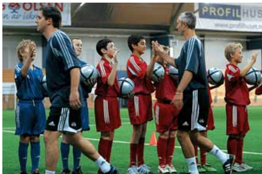
Le salut des «modèles» aux jeunes footballeurs.

meilleurs entraîneurs sont souvent ceux qui en savent plus sur les enfants que sur le football. La composante «connaissance du football» ne prend tout son sens qu'à un niveau plus élevé. Les cours d'entraîneurs doivent donc être conçus soigneusement et, les techniciens ont insisté sur ce point à Oslo, il ne faut pas oublier – quels que soient les intérêts, sociaux, politiques ou financiers sous-jacents – que nous parlons du Football avec un F majuscule. La spécialisation,