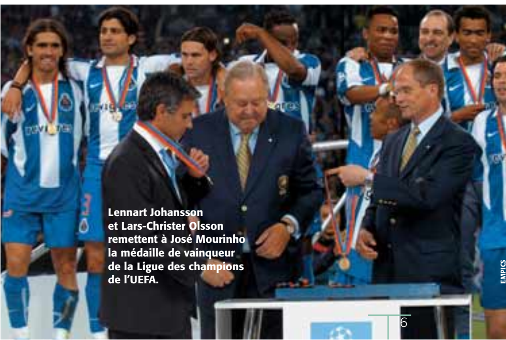
Lennart Johansson et Lars-Christer Olsson remettent à José Mourinho la médaille de vainqueur de la Ligue des champions de l'UEFA.