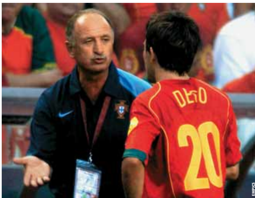
Luiz Felipe Scolari donne ses consignes à son meneur de jeu Deco.

«Nous avons un certain nombre de problèmes récurrents en Espagne. Nous sommes un des pays qui importent le plus de joueurs et, étonnamment, les