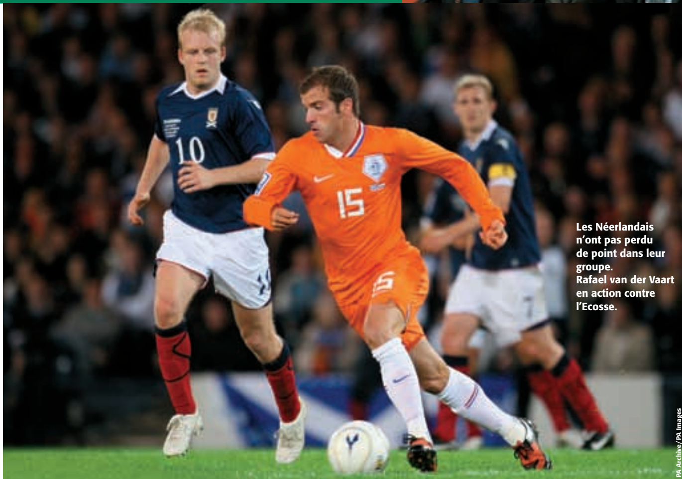
Les Néerlandais n'ont pas perdu de point dans leur groupe. Rafael van der Vaart en action contre l'Écosse.