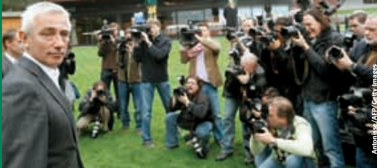
Antonisse / AFP/Getty Images