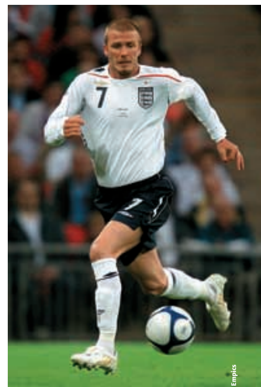
David Beckham: un expert dans l'art de soigner son image.

Si le produit est pauvre et l'image mauvaise, la marque sera alors faible. Dans le football, cela signifie que les entraîneurs et les joueurs doivent assumer leur rôle dans la promotion et la protection du jeu. Nombre d'entre eux vont gagner de l'argent grâce aux droits d'image mais ces droits entraînent une responsabilité. La terminologie est nouvelle – marques, images, produits – mais l'histoire est ancienne. Talent, authenticité, attractivité et fair-play sont les pierres angulaires du football et les ingrédients fondamentaux pour les clients. On dit qu'une marque est une promesse – mais c'est bien plus que cela – le FC Barcelone, David Beckham et la Ligue des champions de l'UEFA devraient être une garantie de qualité et les techniciens du football devraient figurer en première ligne pour livrer un «produit» qui soit saisissant, spectaculaire et sans bavures.