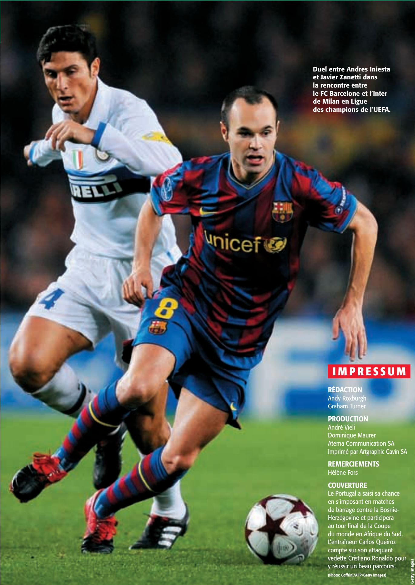
Duel entre Andres Iniesta et Javier Zanetti dans la rencontre entre le FC Barcelone et l'Inter de Milan en Ligue des champions de l'UEFA.