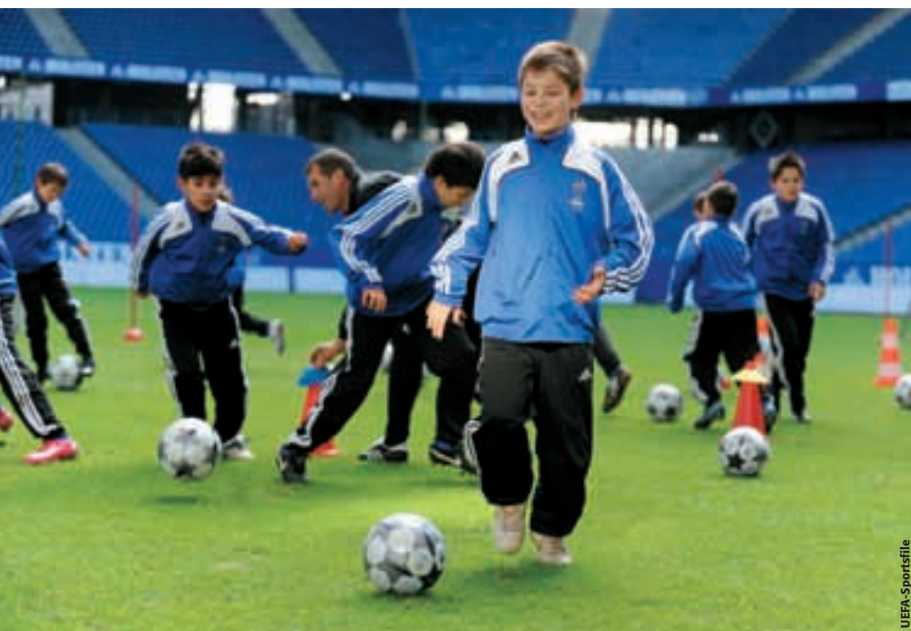
Des installations de rêve pour ces jeunes joueurs lors de l'Atelier du football de base de l'UEFA à Hambourg.

C'est la procédure qui a été suivie durant l'année 2009 et l'année s'est achevée avec des recommandations pour décerner à l'Islande une quatrième étoile (l'étoile sociale et du football handisport). La même étoile a permis à la Géorgie de passer du statut une étoile à celui de deux étoiles, tandis que la République d'Irlande a combiné la même étoile avec la participation des jeunes filles pour obtenir le statut trois étoiles. Quant au Liechtenstein et à la Suède, ils ont reçu l'aval pour les participants enregistrés, le football féminin et les catégories promotion et croissance pour atteindre le statut quatre étoiles. Le fait que les 47 membres partagent