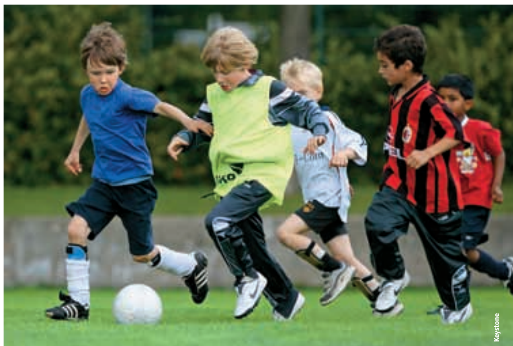
Le football de base est un excellent moyen d'intégration.

Nous avons dénombré 1,3 million de téléspectateurs pour la finale de la Coupe du monde des moins de 17 ans au Nigeria et dans l'ensemble, il a été dit que 40% de la population s'étaient branchés sur le match à un moment ou à un autre. Nombre de téléspectateurs étaient des enfants et nos moins de 17 ans sont devenus des idoles pour eux. Comme je l'ai dit précédemment, nos clubs sont à la limite en termes de contingent mais les exploits de notre équipe junior encourageront de nombreux joueurs à accroître leur engagement et à améliorer leur niveau technique. Quand nous avons remporté le titre européen en 2002, cela a eu un effet et maintenant ce succès de nos jeunes champions en Coupe du monde fera des émules parmi d'autres joueurs. Le département technique d'une association doit concentrer ses efforts à la fois sur le football de base et sur le football d'élite junior – ils sont liés et d'une égale importance. Si vous êtes directeur technique, vous devez aimer de la même passion le football de base et le football d'élite junior.