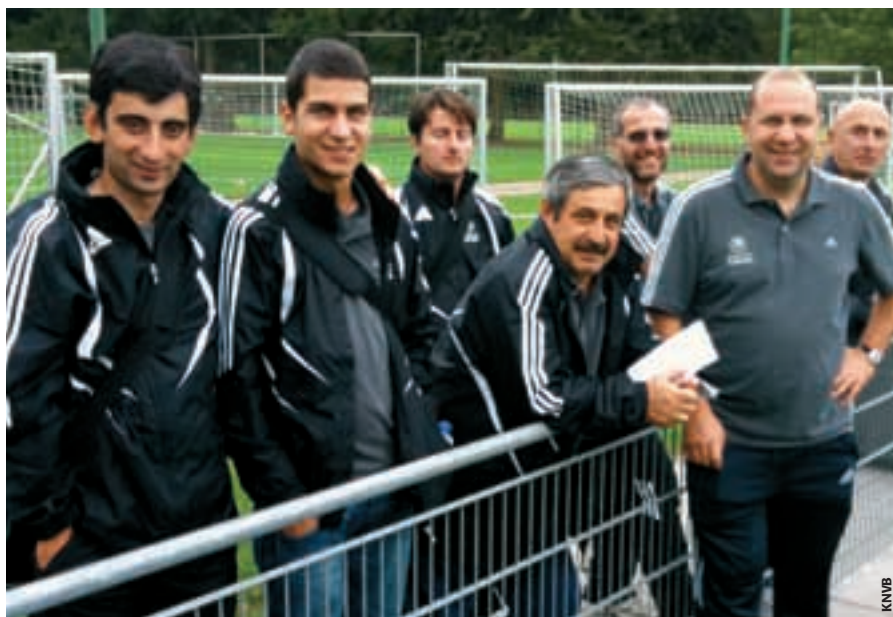
Visite aux Pays-Bas pour des délégations de Belarus, Bosnie-Herzégovine et Géorgie.