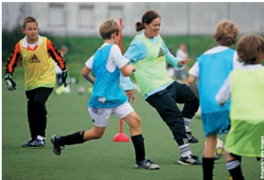
L'ancienne internationale allemande Renate Lingor participe à une séance du programme «DFB Mobil».

Le concept consistant à utiliser les manifestations de l'élite comme tremplin pour les activités du football de base est actuellement appliqué durant les préparatifs de deux grands tournois de football féminin que l'Allemagne va accueillir: la Coupe du monde 2011 et le tour final des moins de 20 ans dont le coup d'envoi sera donné en juillet 2010. Quelque 80 projets au niveau du football de base local ont été prévus dans le cadre du soutien du DFB; les écoles et les clubs ont été engagés dans le projet «Team 2011» et toute une palette de manifestations est organisée sous la bannière de «Rêves d'enfants 2011». Le DFB offre un soutien financier aux organisations et aux groupements locaux à but non lucratif; des projets pour les adolescents et les enfants socialement défavorisés