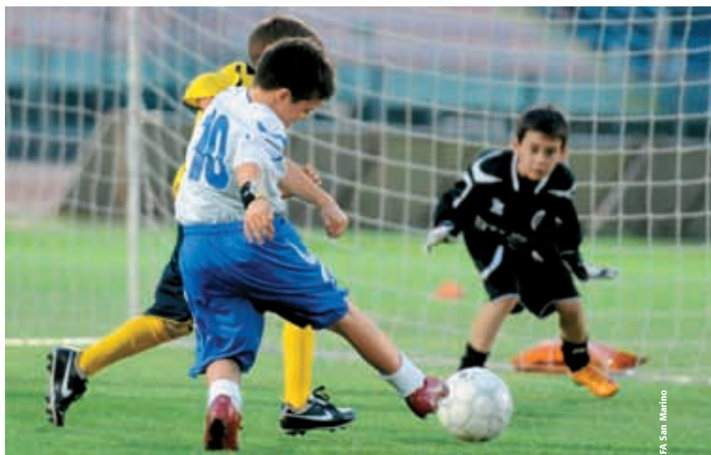
La Journée du football de base de l'UEFA donnera lieu à l'organisation de manifestations de football de base dans toute l'Europe.

De même que le football prend racine dans le football de base, les préparatifs pour la première finale de la Ligue des champions de l'UEFA se disputant un samedi commenceront par des activités liées au football de base. Après la Journée du football de base, le mercredi, le jeudi soir verra se jouer la finale de la Ligue des champions féminine de l'UEFA. Deux jours plus tard, la compétition reine des clubs professionnels européens sera la cerise sur le gâteau et nous rappellera opportunément durant cette semaine que le football de base constitue le gâteau. Reconnaître et célébrer le football de base par une Journée du football de base est par conséquent une initiative qui sera pleinement approuvée par tous ceux qui portent le football dans leur cœur.