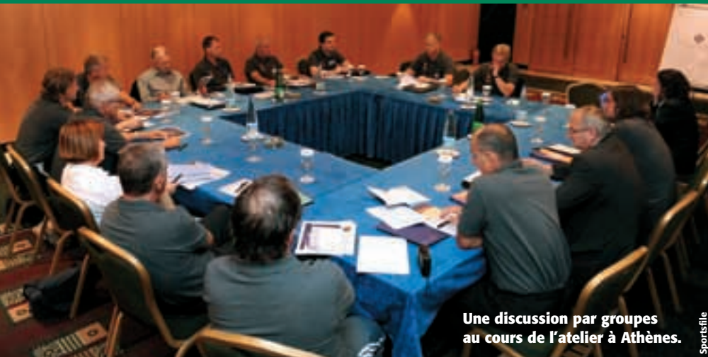
Une discussion par groupes au cours de l'atelier à Athènes.

autres. Aussi apprenons-nous mieux dans un environnement de travail. Au fond, nous parlons du transfert de savoir d'un formateur à un entraîneur puis de l'entraîneur à l'équipe. Aussi devons-nous nous concentrer sur la mise en relation du contenu des cours de formation des entraîneurs avec le lieu de travail.»