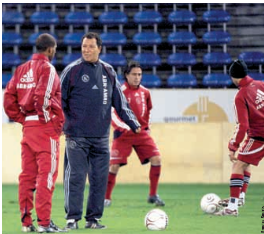
Henk ten Cate lors d'une séance d'entraînement avec les joueurs d'Ajax.

Une des priorités est d'avoir une philosophie du football. Nous devons investir dans l'avenir du football et montrer le même engagement que celui que j'ai partagé dans mon ancienne équipe Go Ahead Eagles. Le problème est que le club a vendu son centre de formation pour faire partie d'un partenariat. Quand je ne serai plus entraîneur, j'aiderai le club à revenir à un niveau plus élevé. La première mesure à prendre sera de récupérer le centre de formation. Si vous avez un bon centre de formation, vous obtenez toujours un retour.