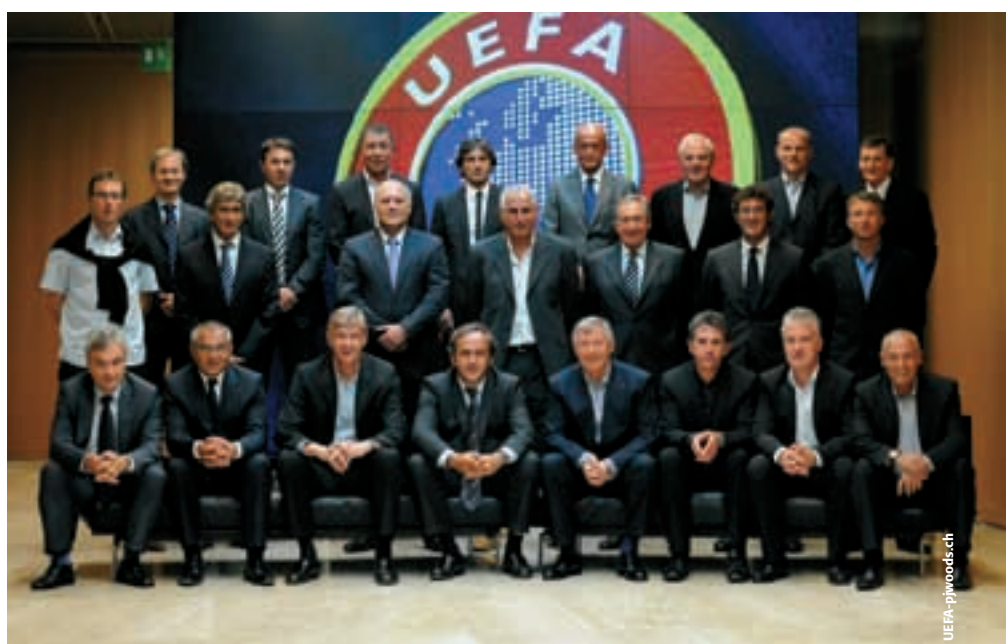
Les entraîneurs des clubs d'élite au 11 e Forum.

entraîneurs de clubs d'élite qui se sont rencontrés à Nyon, les défis que constituent les qualités de leader et de gestion des hommes. Un phénomène endémique aux vestiaires modernes caractérisés par la mondialisation et pas réputés pour leur manque d'egos. D'après le poète anglo-américain W.H. Auden, «le triomphe est agréable et la défaite douloureuse mais, pour un égoïste, tous deux sont intéressants dans une égale mesure, parce que ce qui compte ce n'est pas le contenu de l'expérience mais le fait que ce soit la sienne». Dans cette optique, il a été intéressant d'entendre les entraîneurs émettre l'avis qu'un certain degré d'égoïsme est positif s'il peut être associé à une mentalité de vainqueur. «Une vedette, a dit quelqu'un, ne pose pas autant de problèmes qu'un joueur pensant qu'il en est une mais qui ne l'est pas ou qui ne l'est plus.» C'est un thème auquel l'on a donné de la continuité lors de l'atelier de travail sur la formation des entraîneurs à Athènes trois semaines plus tard quand l'un des sujets à l'ordre du jour a été comment préparer les techniciens de l'avenir à traiter les pressions générées au sein de l'environnement qui est celui des professionnels de l'élite. Le dernier mot est revenu à Alex Ferguson: «Une perspective qui tend à être oubliée, a-t-il fait remarquer, est qu'il appartient aux joueurs de vous rendre heureux – et pas le contraire.»