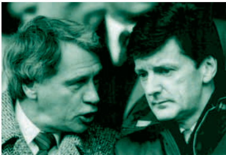
Bobby Robson en conversation avec Andy Roxburgh, directeur technique de l'UEFA, quand ils entraînaient respectivement l'Angleterre et l'Ecosse.

Quand Bobby quitta Newcastle United, il appela Gérard Houllier qui venait précisément de se séparer du FC Liverpool. Sans la moindre marque d'arrogance (Bobby était l'humilité en personne), il dit à son collègue entraîneur: «Comment vont-ils pouvoir nous remplacer?» Il n'était pas nécessaire de répondre à la question. Bobby Robson était unique. Un homme de terrain, un inspirateur pour beaucoup, une personnalité dont on se souviendra avec une immense admiration et avec un sourire.