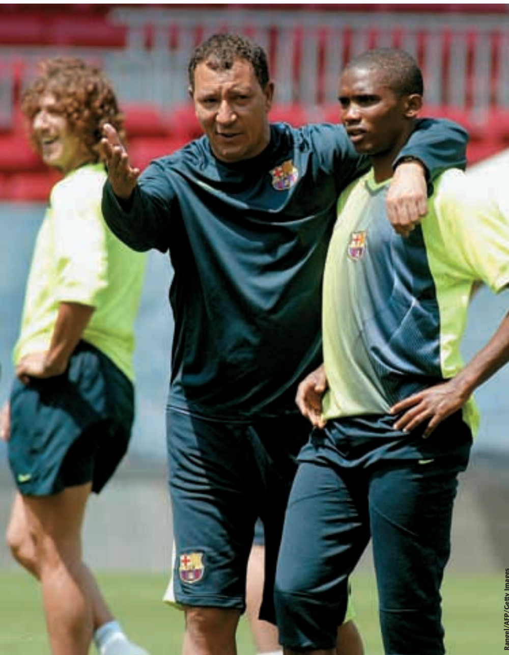
A Barcelone, prodiguant des conseils à Samuel Eto'o.

Un club doit avoir une politique à court terme et une politique à long terme – sans un centre de formation il ne peut y avoir de politique à long terme et vous payerez finalement le prix.