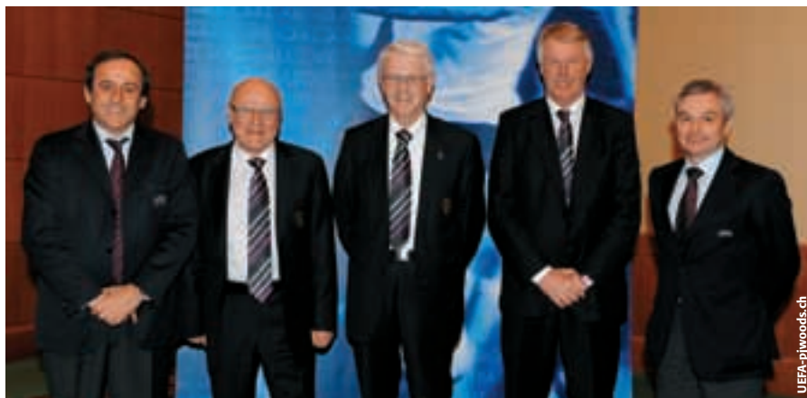
Entre Michel Platini et David Taylor, les représentants de la Suède lors de la cérémonie de signature de la Convention de l'UEFA sur l'arbitrage.

La Convention sur la formation des arbitres est le dernier enfant du bloc d'appui visant à rehausser la formation des arbitres, améliorer le niveau des instructeurs d'arbitres, définir un statut professionnel et juridique et s'assurer que les organisations de l'arbitrage demeurent à l'abri de l'influence d'autres instances telles que les gouvernements, les ligues et les clubs. Le Panel de la Convention concernant l'arbitrage est l'équivalent du panel Jira en cela qu'il fixe des standards de qualité minimaux, examine les candidatures, évalue et contrôle la mise en œuvre de références de qualité. Bien qu'elle ait moins de quatre ans, la Convention sur l'arbitrage compte 25 signataires, le même nombre de candidatures se trouvant en suspens. Ces chiffres – et les réactions positives des associations nationales – permettent de penser que le programme d'appui est avalisé sans réserve.