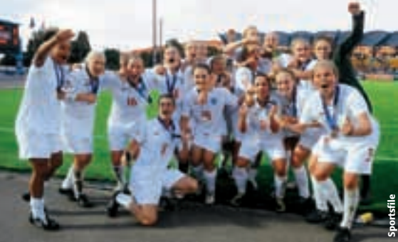
L'ÉQUIPE FÉMININE ANGLAISE DES M19, CHAMPIONNE D'EUROPE.