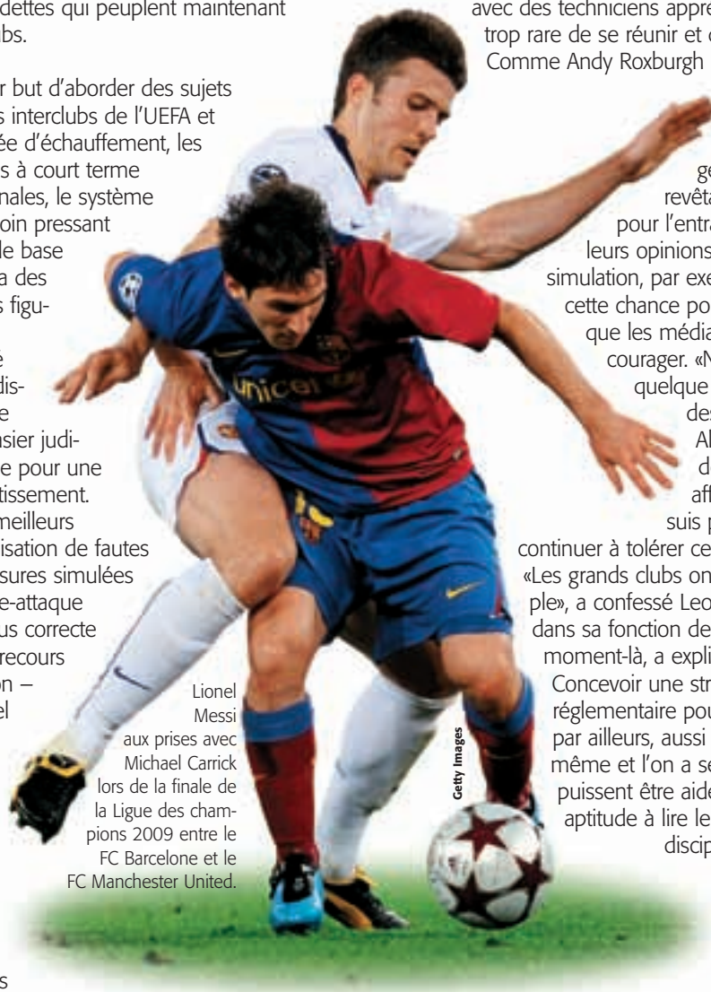
Lionel Messi aux prises avec Michael Carrick lors de la finale de la Ligue des champions 2009 entre le FC Barcelone et le FC Manchester United.