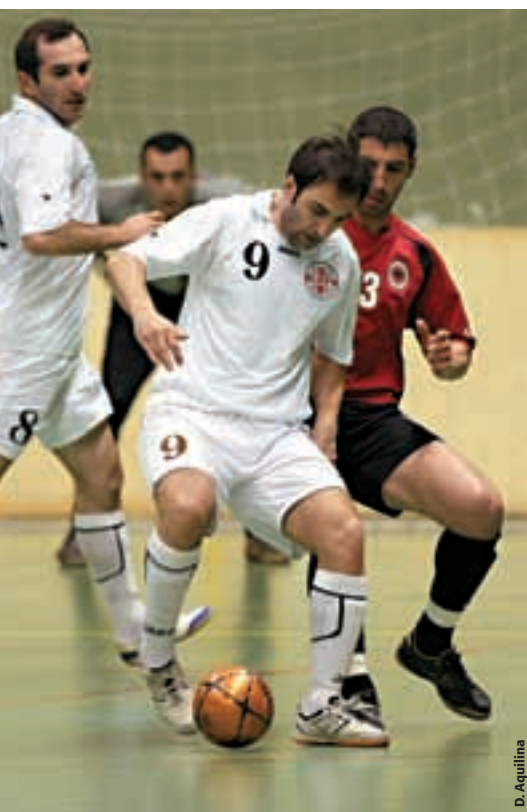
Match de qualification du Championnat d'Europe de futsal entre l'Albanie et la Géorgie.