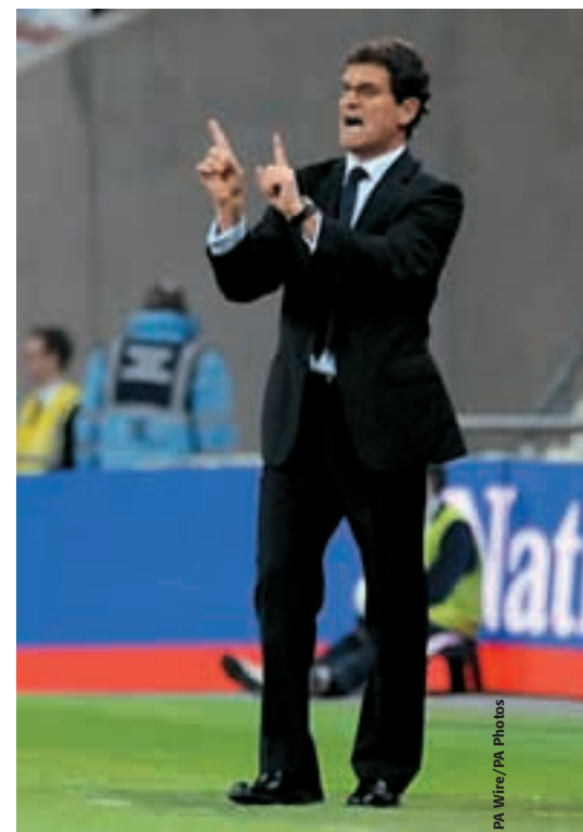
Fabio Capello dans une attitude expressive dans la zone technique.

En modifiant le texte concernant la zone technique, l'IFAB a adopté une approche relevant du bon sens et a manifesté du respect pour les techniciens et le rôle qu'ils assument dans le football d'aujourd'hui. Pour que le travail de l'entraîneur et les conditions de travail sur la ligne de touche soient admises et reconnues de manière tangible, la procédure a été longue et parfois pénible. La zone technique, quand elle est utilisée adéquatement, ajoute au football une dimension importante et positive. Nous avons parcouru un long chemin depuis l'introduction du banc des entraîneurs au FC Aberdeen – espérons que la liberté accordée récemment à l'entraîneur réduira les conflits et augmentera le flegme qui sied aux professionnels sur la ligne de touche. Au fond, le football est un sport pour les joueurs. Mais les entraîneurs peuvent apporter une contribution substantielle au succès individuel et à celui de l'équipe – sur le terrain d'entraînement, dans le vestiaire et de la zone technique.