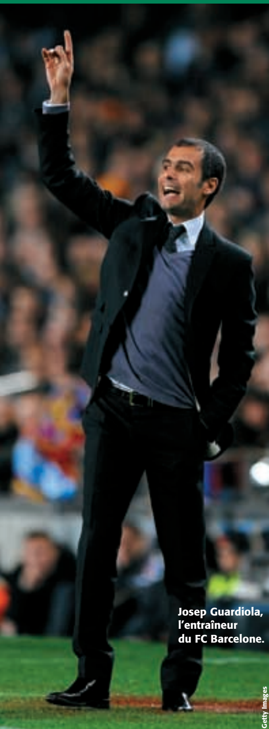
Josep Guardiola, l'entraîneur du FC Barcelone.