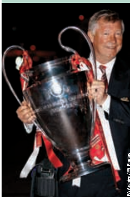
Alex Ferguson et le trophée de la Ligue des champions, remporté par Manchester United en 2008.

Eh bien, ils ont certainement changé en termes de soutien nécessaire, en particulier dans le domaine de la science sportive. L'information médicale, la nutrition et la préparation des joueurs pour les matches dans le football d'élite ont atteint un autre niveau. Ce qui n'a pas changé, dans notre cas, c'est que les joueurs s'entraînent toujours à un niveau élevé – nous avons toujours visé la qualité à 100%. Je n'ai jamais changé cette approche parce qu'à mon sens, ce que l'on fait sur le terrain d'entraînement se retrouve le jour du match. Nous n'avons jamais permis que les séances d'entraînement se déroulent dans la nonchalance. Pour moi, l'entraînement est une occasion pour les joueurs de s'exprimer en tant que professionnels. Les joueurs qui ne s'engagent pas à l'entraînement peuvent avoir une influence négative sur les autres et les choses peuvent dégénérer en pagaille –