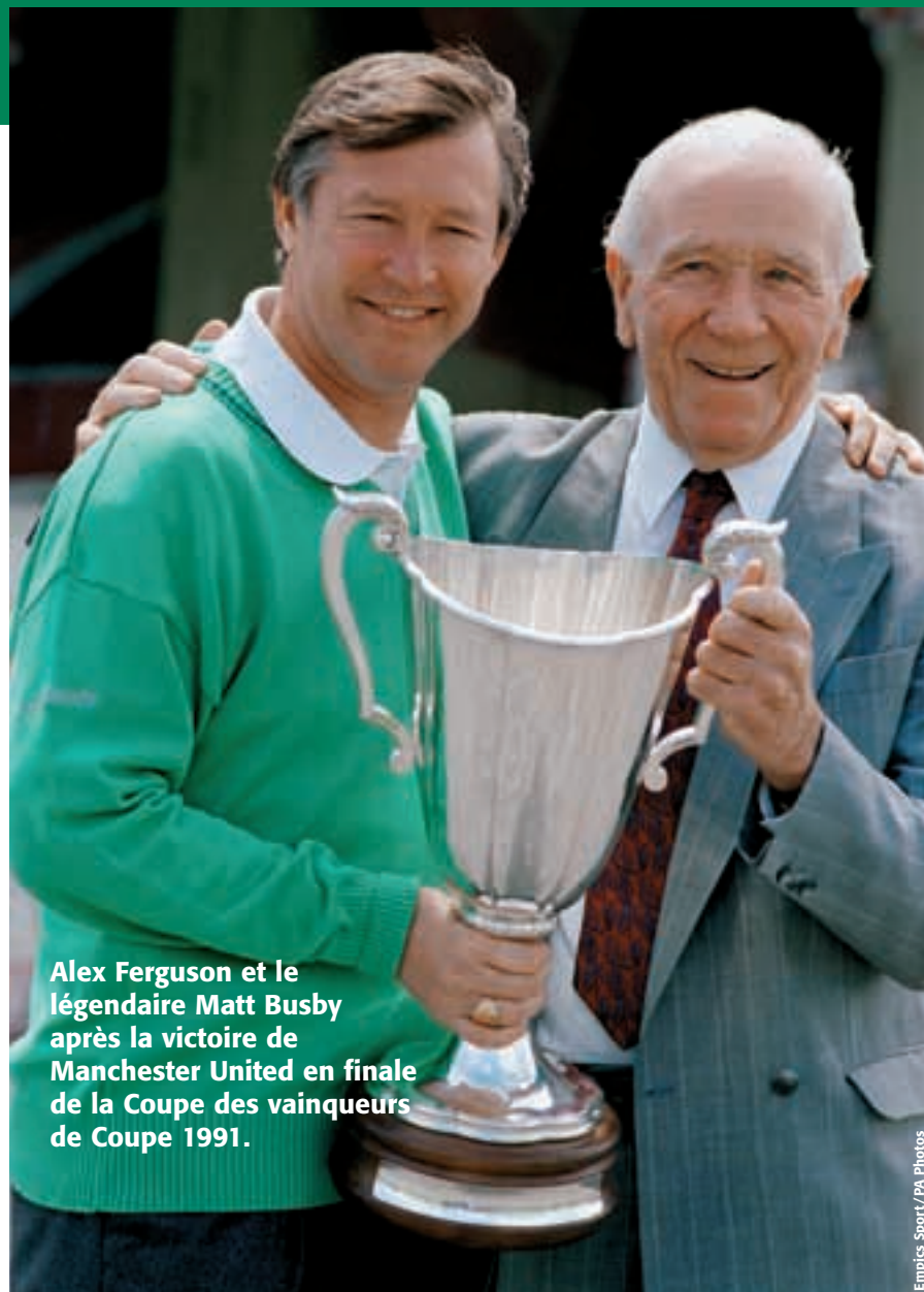
Alex Ferguson et le légendaire Matt Busby après la victoire de Manchester United en finale de la Coupe des vainqueurs de Coupe 1991.