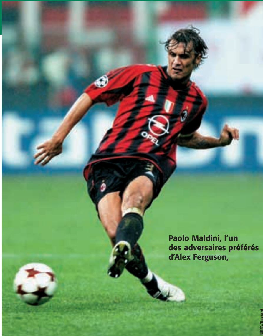
Paolo Maldini, l'un des adversaires préférés d'Alex Ferguson,