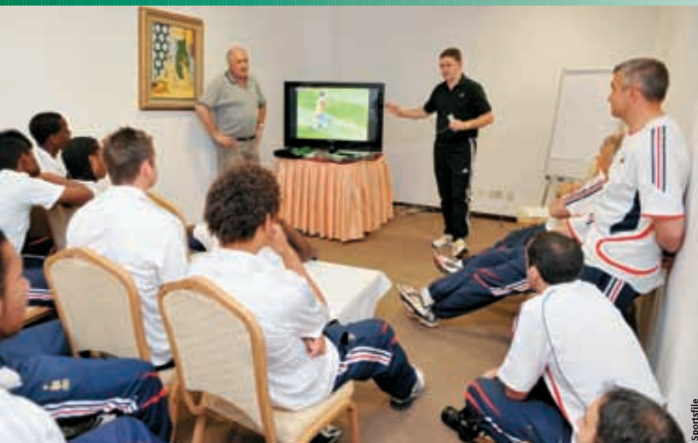
Des explications aux M17 français lors du tour final de leur Championnat d'Europe en 2008.

pétitif qui est sujet à un examen exhaustif du public. Ils doivent être armés pour maîtriser les crises, le stress et des egos considérables. Ils doivent être prêts à prendre des risques et de grandes décisions. En d'autres termes, les connaissances et le talent peuvent être importants mais ils ne suffisent pas nécessairement. La personnalité compte – en particulier à une époque où la position de leader et les décisions sont volontiers contestées.