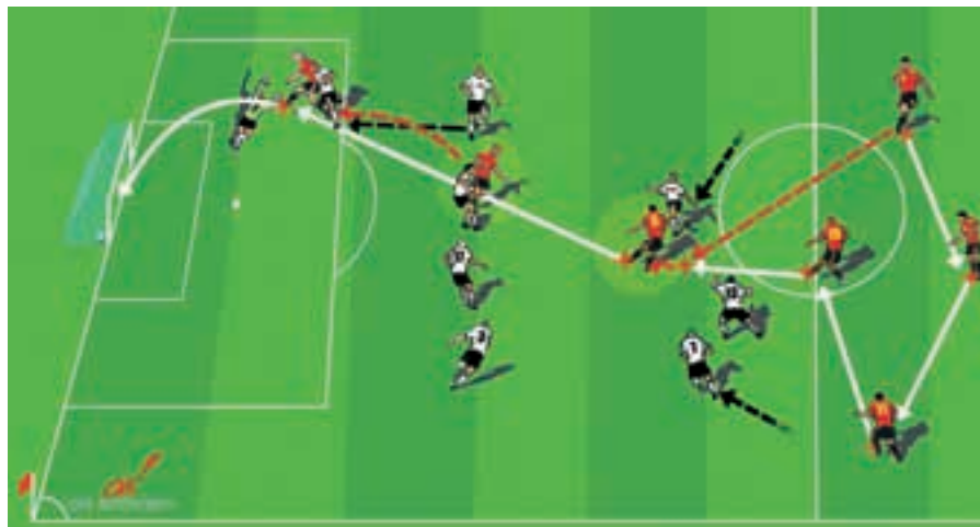
Une passe incisive de Xavi pour le but victorieux de l'Espagne en finale.

Les Néerlandais ont exercé la manière dont ils ont joué et l'accent a été mis sur une pression d'une intensité élevée et de rapides changements de jeu lors de matches bien précis durant la phase de préparation. Ils ont montré qu'ils étaient prêts en produisant leurs mouvements sensationnels de contre-attaque contre l'Italie lors de leur premier match à Berne. La volonté des «Oranje» à soutenir de rapides contre-attaques était déjà évidente à l'entraînement.