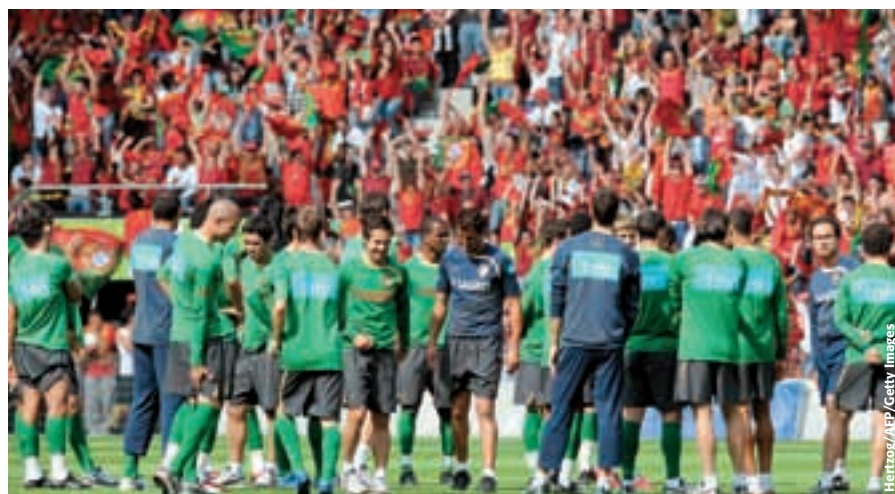
L'équipe portugaise a rassemblé plus de 12 000 supporters à chacun de ses entraînements publics au stade de la Maladière à Neuchâtel.

LES ÉQUIPES QUI ONT PARTICIPÉ À L'EURO 2008 ONT EU DEUX SEMAINES ET DEMIE POUR SE PRÉPARER AVANT LEUR PREMIER MATCH. DURANT CETTE PÉRIODE, DIVERSES MÉTHODES ONT ÉTÉ UTILISÉES POUR AMÉLIORER LA CONDITION PHYSIQUE (LA RÉCUPÉRATION ET LA RÉGÉNÉRATION ONT ÉTÉ PARTICULIÈREMENT IMPORTANTES), LES CONNAISSANCES TACTIQUES, L'ASPECT INDIVIDUEL ET LA COORDINATION AU SEIN DE L'ÉQUIPE. CERTAINES ÉQUIPES ONT VÉRITABLEMENT PERSONNALISÉ LES PROGRAMMES D'ENTRAÎNEMENT AVANT LE TOURNOI EN TENANT COMPTE DE LA CHARGE DE TRAVAIL SUPPORTÉE PAR LES JOUEURS INDIVIDUELLEMENT PENDANT LA SAISON.