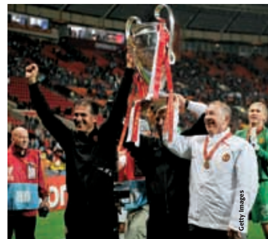
Le Manchester United d'Alex Ferguson est un champion du football offensif.

L'objectif dans le football professionnel est de remporter les matches mais de plus en plus les propriétaires, le public et les médias exigent que cela soit fait avec style et panache. Comme dans l'écriture où la bonne prose fournit la structure de base mais la poésie hisse le texte à un niveau supérieur de créativité, le football de haut niveau a besoin à la fois d'une organisation efficace et rationnelle et, si possible, d'un engagement en faveur d'un habile jeu offensif. L'ancien entraîneur de Real Madrid Vanderlei Luxemburgo a souligné l'attitude requise quand il a déclaré à ses collègues entraîneurs brésiliens lors d'une conférence à Rio: «Avoir peur de perdre tue la volonté de gagner.» L'EURO 2008 a été une magnifique publicité pour le football européen avec des équipes brillantes alliant passion pour la cause, un excellent jeu d'équipe et un football ouvertement attrayant. L'objectif est de gagner mais la manière dont le résultat s'obtient a acquis une plus grande signification dans l'environnement exigeant du football d'élite. «Je pense que ceux qui aiment le football veulent des joueurs qui fassent de belles combinaisons, qui pénètrent dans la zone de réparation et qui marquent des buts», a déclaré l'Espagnol Luis Aragonés dont l'équipe a non seulement pratiqué un football fantastique mais l'a marié aux résultats et, ce faisant, elle a fixé un standard de performance qui peut servir d'exemple à d'autres équipes en Europe.