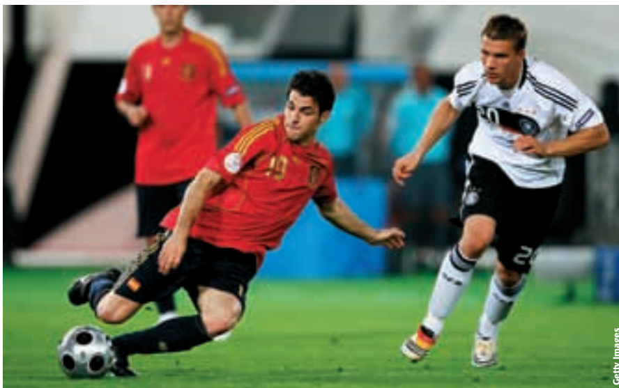
Cesc Fabregas, un des nombreux joueurs espagnols à avoir confirmé un talent détecté lors des compétitions juniors européennes.

Cela n'arrive pas très souvent. L'exemple qui saute à l'esprit est Bojan Krkic qui vous frappe d'emblée comme un joueur extraordinaire. Il avait d'énormes qualités et il était évident qu'il était capable de faire des choses que les enfants de son âge ne font ordinairement pas. Le fait dans ce métier est que vous regardez vers l'avenir dans une certaine mesure seulement – vous