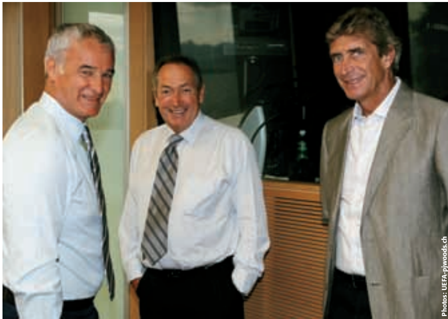
Gérard Houllier entouré de Claudio Ranieri et Manuel Pellegrini.

La question posée aux entraîneurs lors du forum a été d'une trompeuse simplicité: dans les compétitions d'élite, qu'est-ce qui fait la différence? Personne n'a fourni une réponse instantanée et définitive – mais les contributions ont suscité la réflexion. Alex Ferguson, par exemple, a identifié la fraîcheur, la rotation des joueurs au sein de l'effectif, des analyses à plus long terme de la forme d'un