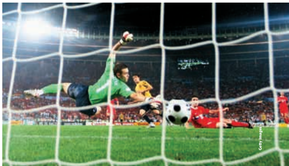
David Silva marque le troisième but espagnol dans la demi-finale contre la Russie à Vienne.

Dans ce premier numéro de The Technician , Andy Roxburgh concluait son éditorial en ces termes: «Il ne fait pas de doute que le football peut stimuler, de manière positive, les passions d'une nation, exciter l'imagination des jeunes et unir les gens en dépit de leurs différences locales.» Les tendances viennent et passent peut-être mais cela au moins n'a pas changé.