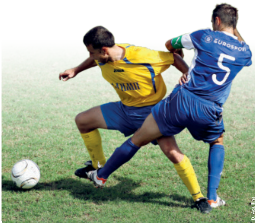
Match de qualification entre Olimp Moscou (en jaune) et la sélection de Gozo (Malte).

Les six autres participants ont démontré leur force en remportant tous leurs matches. La péninsule ibérique, qui a fourni trois des sept vainqueurs précédents, aura pour représentant la sélection de la Catalogne qui a eu besoin d'un but inscrit dans le temps additionnel contre les Ardennes pour se qualifier. L'équipe du Belarus du FC Isloch a remporté ses trois matches de