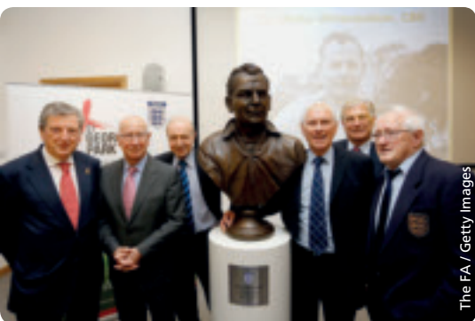
Un buste en l'honneur du pionnier Walter Winterbottom.

Pionnier de son époque, Walter Winterbottom a été gratifié d'un buste spécial à son honneur au centre national de la Fédération anglaise de football (FA) à St. George's Park.