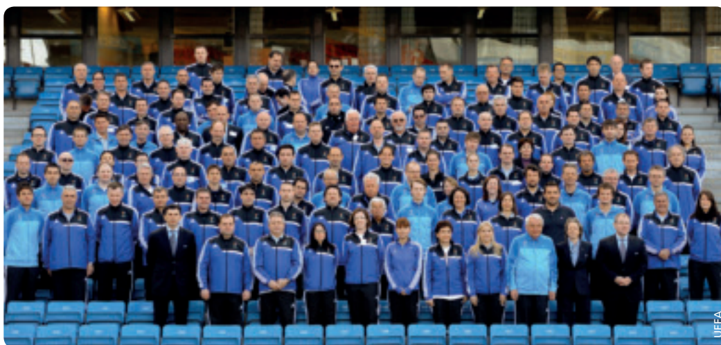
Les participants réunis au stade Ullevaal.

L'atelier été un succès remarquable – et l'on en apprendra encore davantage à ce sujet en lisant l'UEFA•grassroots newsletter, insérée dans ce numéro. ●