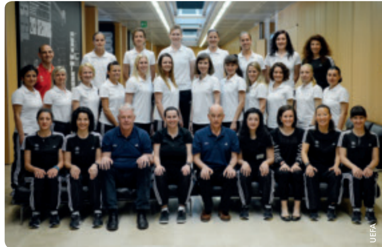
Une formation de qualité pour permettre la progression des jeunes arbitres réunies à Nyon.

Le cours CORE encourage aussi les arbitres à poursuivre leur amélioration. «Je pense qu'elles ont trouvé le niveau d'attente de CORE plus élevé – elles ont pu constater l'approche professionnelle, la discipline, la routine», a ajouté David Elleray. Les arbitres des deux dernières finales de la Ligue des champions