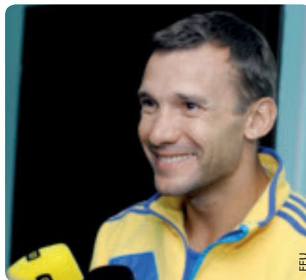
Andriy Shevchenko veut marcher sur les traces de son maître Valeriy Lobanovsky.

«Tout d'abord, je suis Ukrainien, élève du football ukrainien», a déclaré Andriy