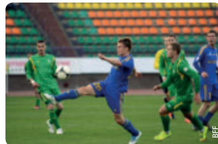
Tous les matches de la plus haute division du Belarus peuvent maintenant être vus en direct sur Internet.

La saison 2013-14 vient de commencer au Belarus et, dorénavant, les supporters de tout le pays et les personnes intéressées par notre championnat national peuvent assister à tous les matches en direct sur Internet. Malheureusement, les chaînes TV du Belarus n'ont pas les ressources pour retransmettre tous les matches chaque week-end (actuellement la société de TV nationale retransmet un match important de chaque journée). Compte tenu de cette situation, la Fédération de football du Belarus (BFF) a abordé cette question sous un angle différent.