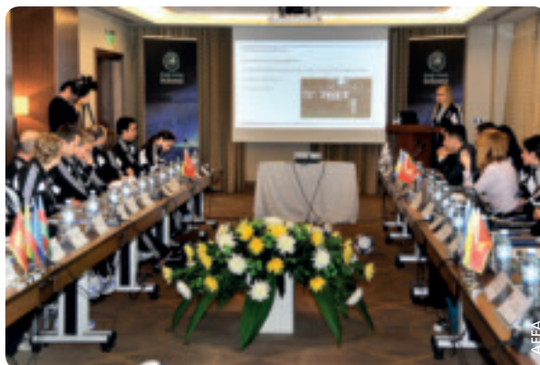
Séance de travail sur le thème du football féminin à Bakou.

La manifestation a été efficace en termes de partage de valeurs communes et d'objectifs futurs sur le développement du football grâce aux discussions aux présentations