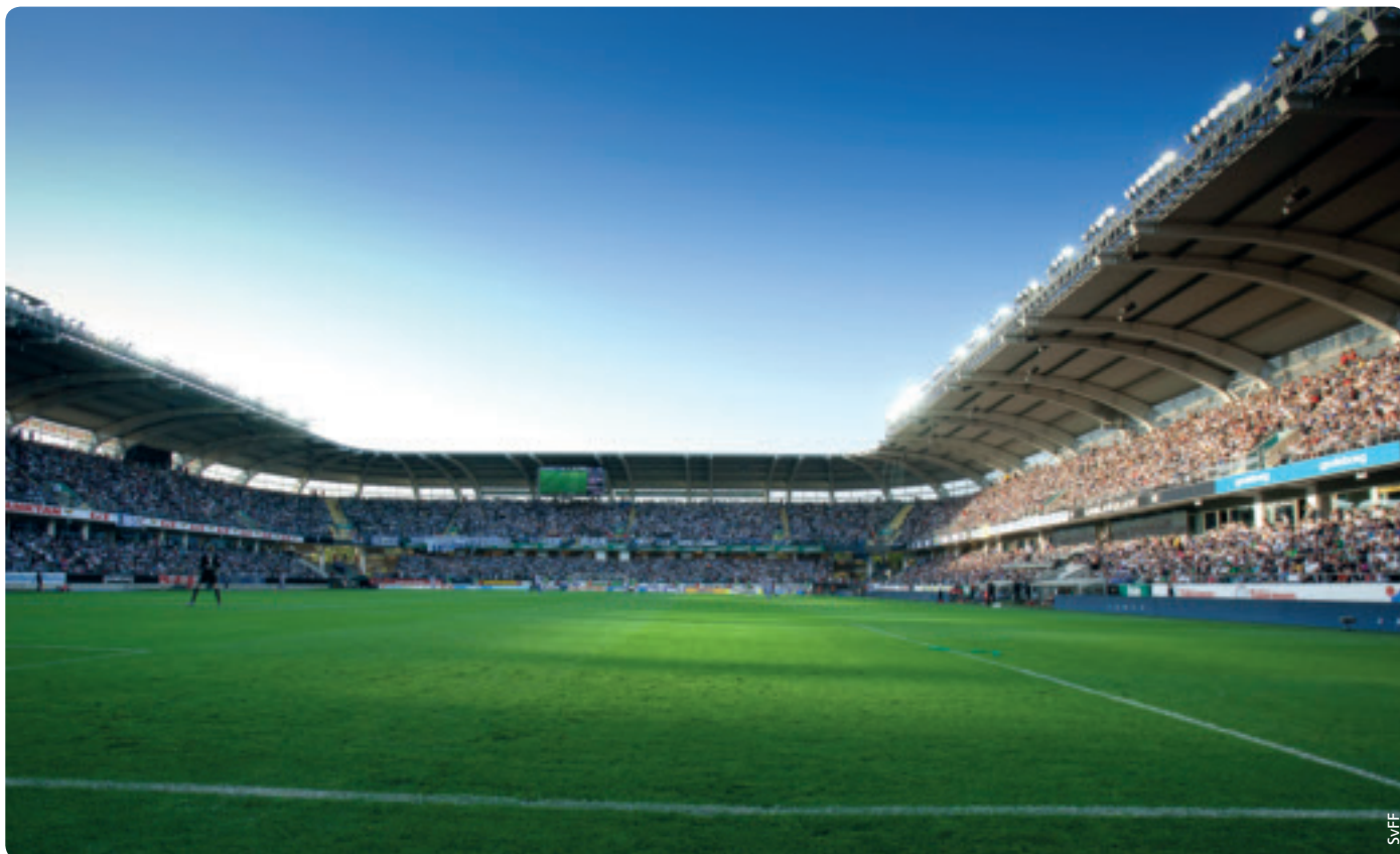
Le stade Gamla Ullevi de Göteborg accueillera des rencontres du groupe A.

Le 4 octobre 2010, la Suède a été désignée pour accueillir l'EURO féminin 2013. Cette candidature reposait sur un concept qui mettait l'accent sur le développement du football féminin, un concept appelé «Winning Ground» – gagner du terrain.