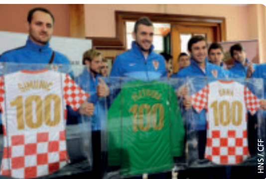
HNS / CFF

Un maillot frappé du numéro 100 pour les trois internationaux croates aux cent sélections.