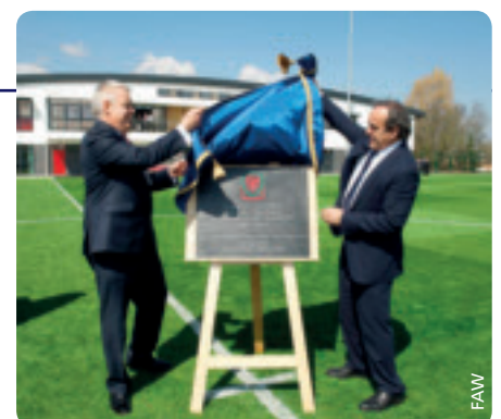
Michel Platini et le premier ministre gallois Carwyn Jones dévoilent la plaque commémorative.

Les installations du centre comprennent trois terrains – deux terrains classés en catégorie supérieure, le troisième étant un terrain synthétique de la troisième génération –, un bâtiment