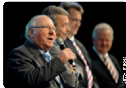
La parole à Uwe Seeler.