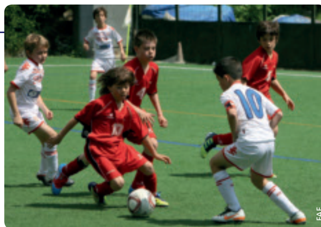
Un tournoi devenu une institution.

Les années précédentes, des clubs espagnols tels que RCD Espanyol, Valence ou Atlético Osasuna ont dominé la situation sur le terrain mais la véritable réussite a été le plaisir, le fair-play et l'enthousiasme manifestés par tous les participants. La FAF est d'avis que c'est une formidable occasion de promouvoir notre football de base avec la participation d'une équipe dans chaque catégorie.