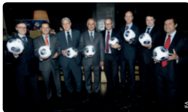
Le président Avraham Luzon entouré des ambassadeurs des pays des équipes du tour final européen des M21.

Maintenant que la vente des billets a débuté, plusieurs dizaines de milliers de supporters se sont déjà assurés une place pour le tournoi et le rythme des ventes des abonnements et des billets augmente de jour en jour. L'association s'est elle-même fixée pour objectif de remplir les stades pour tous les matches et, à cette fin, elle a engagé une coopération avec les autorités des villes qui accueilleront les matches.