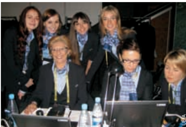
Une équipe souriante dans les coulisses du tirage au sort de Kiev.

Les postes proposés, qui sont rémunérés, couvrent les domaines de la télévision et de la production vidéo, de la logistique de la production du signal TV et des services aux diffuseurs. Ce programme dispose de sa propre identité et est destiné aux facultés des médias, du journalisme et des sports de chaque université. Il offre