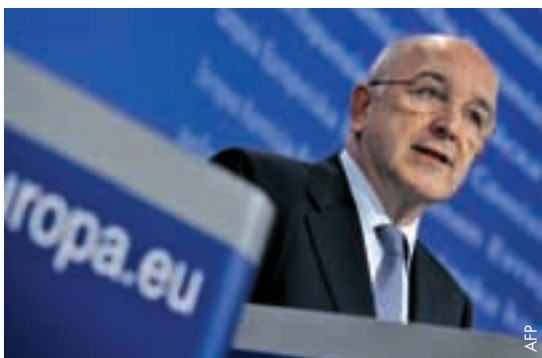
Joaquín Almunia, commissaire européen chargé de la Concurrence.

● Le Président de l'UEFA, Michel Platini, a rencontré, en décembre, Viviane Reding, vice-présidente de la Commission européenne et commissaire chargée de la Justice, des Droits fondamentaux et de la Citoyenneté, et Joaquín Almunia, vice-président de la Commission européenne et commissaire chargé de la Concurrence. Le Président de l'UEFA avait été invité par ces deux commissaires à un déjeuner de travail au siège de la Commission européenne, à Bruxelles, qui s'est déroulé dans une atmosphère très constructive.