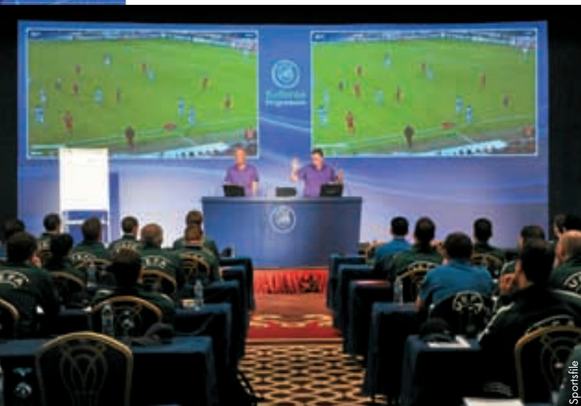
Séance théorique pour les arbitres à Antalya.

Les douze arbitres choisis par la Commission des arbitres de l'UEFA en décembre pour officier lors des matches de l'EURO 2012 sont: Cüneyt Çakır (Turquie), Jonas Eriksson (Suède), Viktor Kassai (Hongrie), Björn Kuipers (Pays-Bas), Stéphane Lannoy (France), Pedro Proença Oliveira Alves (Portugal), Nicola Rizzoli (Italie), Damir Skomina (Slovénie), Wolfgang Stark (Allemagne), Craig Thomson (Ecosse), Carlos Velasco Carballo (Espagne) et Howard Webb (Angleterre). ●