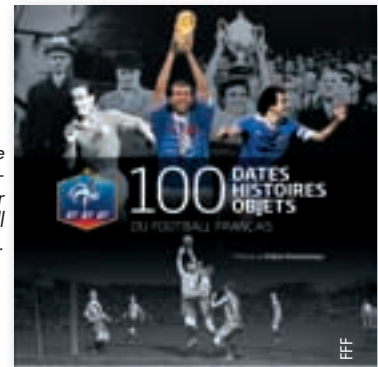
Une mine de renseignements sur le football français.

L'histoire de la FFF est intimement liée à celle du football français. Entamée à la fin du XIX e siècle, cette valse à plusieurs temps a enfanté un fabuleux patrimoine à la fois humain, sportif, culturel et matériel. Un véritable trésor que de nombreux passionnés ignorent ou méconnaissent. En vous proposant 100 dates symboliques, ce livre retrace un siècle de «vie» du football français. Que de belles histoires à vous raconter depuis la gestation de la FFF en 1919, née de la fusion de plusieurs associations pré-existantes.