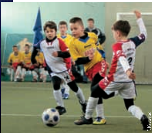
Une rencontre du tournoi «Champions-Junior».