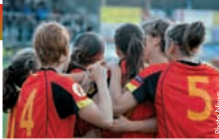
La solidarité, un des atouts à la base des bons résultats de l'équipe féminine belge.

Après avoir disputé quelques matches amicaux, nos dames entamèrent leur campagne de l'EURO 2013 en sachant que leur mission serait difficile vu la présence de deux équipes du top dans notre groupe, à savoir la Norvège et l'Islande. Toutefois, nos joueuses débütèrent de la plus belle des manières en gagnant 2-1 à domicile face à la Hongrie et en allant faire match nul 0-0 en déplacement contre l'Islande. Par la suite, elles continuèrent sur leur lancée, n'encaissant que deux buts en cinq rencontres pour occuper, en janvier, la deuxième place de leur groupe, une position leur permettant d'être toujours en course pour la qualification.