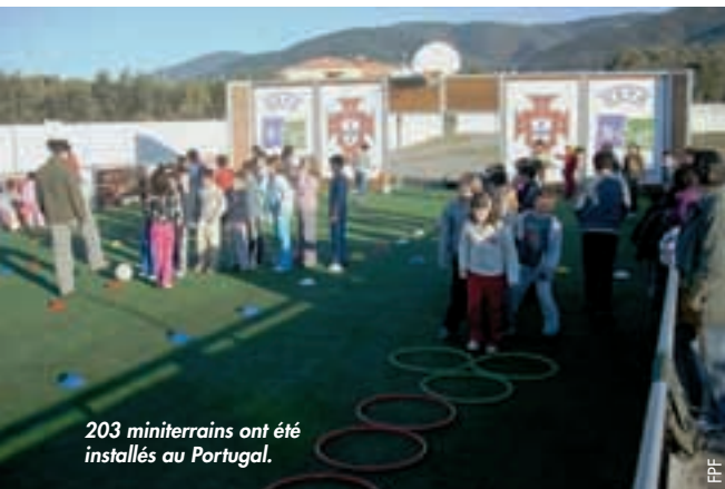
203 miniterrains ont été installés au Portugal.

Dans le cadre du programme HatTrick de l'UEFA, la Fédération portugaise de football (FPF), en partenariat avec le secrétariat d'Etat à la Jeunesse et au Sport et l'Institut du Sport du Portugal, a encouragé la construction de 200 miniterrains polyvalents à travers le pays.