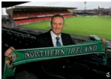
Le nouvel entraîneur national, Michael O'Neill.

Parlant de sa nomination, Michael O'Neill a déclaré: «Je suis honoré d'avoir été choisi pour diriger l'équipe nationale de mon pays. Je suis fier d'être Nord-Irlandais, j'ai eu la chance de porter le maillot national à 31 reprises et gérer l'équipe nationale a toujours été mon rêve. C'est une lourde responsabilité mais je suis convaincu que nous pouvons progresser.»