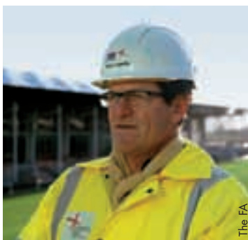
Fabio Capello en visite au Parc St-Georges.

Ce site de plus de 130 hectares au cœur de la Forêt nationale anglaise, devrait ouvrir à la fin de l'été 2012. Il comprendra 12 terrains, dont une réplique de la surface de Wembley et un terrain indoor de taille standard, deux hôtels de 226 chambres et un centre de formation ultramoderne. La FA a travaillé sur les plans avec des spécialistes, en se rendant dans les meilleurs centres nationaux de football du monde.