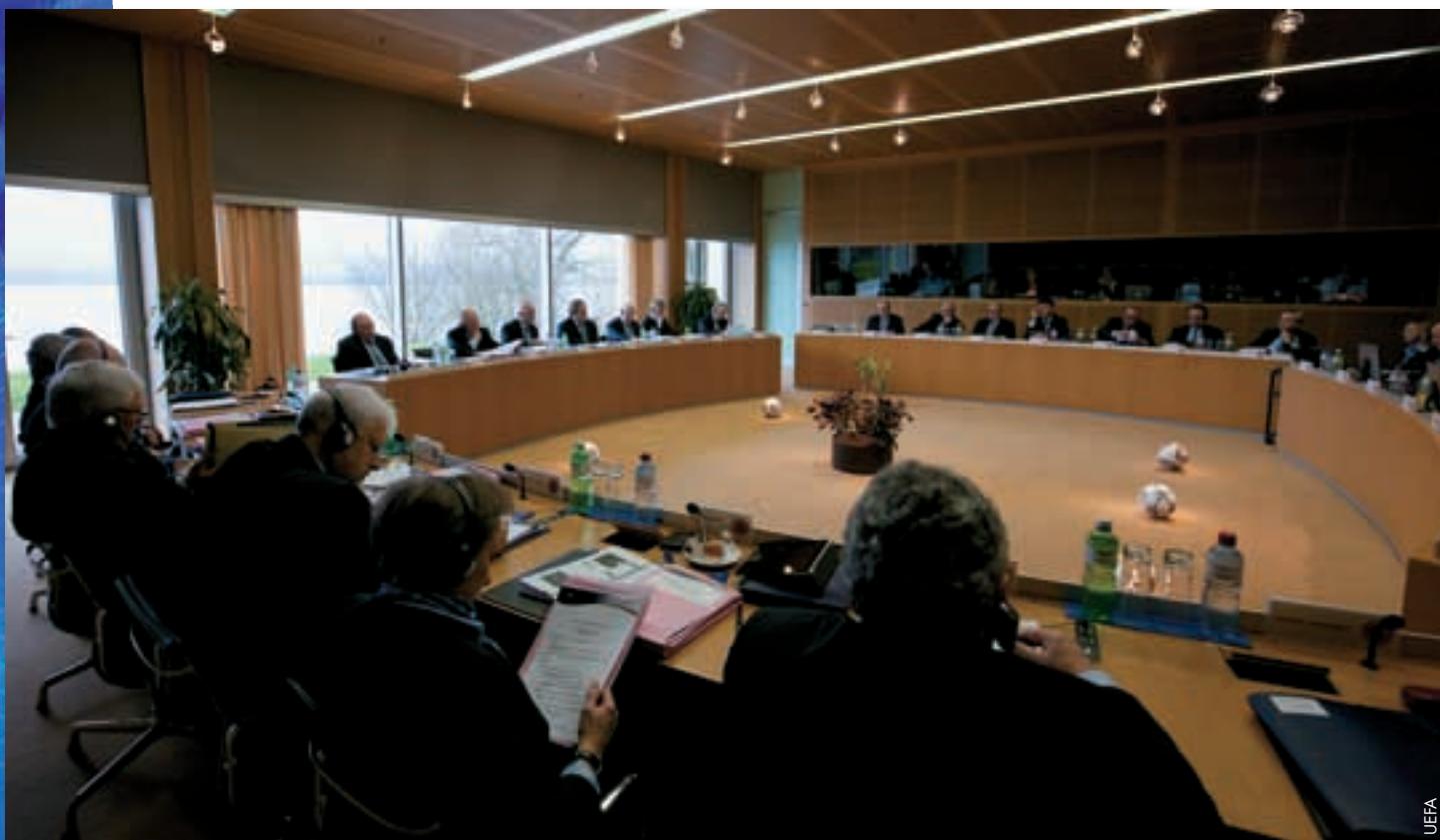
Le comité exécutif lors de sa séance à Nyon.

La métropole turque accueillera le 22 mars le XXXVI e Congrès ordinaire de l'UEFA, le second à se tenir à Istanbul après celui de 1978. Lors de sa première séance de l'année, le Comité exécutif, réuni le 24 janvier à Nyon sous la présidence de Michel Platini a, entre autres, préparé la prochaine assemblée générale des délégués des associations membres de l'UEFA.