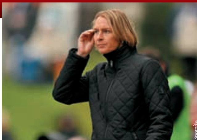
Martina Voss lorsqu'elle était à la tête du FCR 2001 Duisbourg.

Succédant à Béatrice von Siebenthal à la tête de l'équipe nationale et de l'Académie du football féminin, Martina Voss est sans aucun doute une grande pointure du football féminin. Elle est également journaliste et rédactrice en chef du magazine allemand Frauenfussballmagazins FF ,