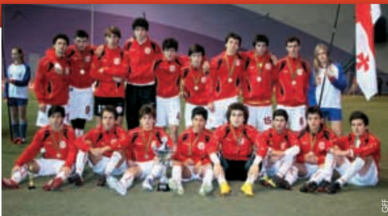
La sélection nationale M17 géorgienne.

Dans le tour Elite du Championnat d'Europe M17, l'équipe géorgienne rencontrera les équipes d'Angleterre, d'Espagne et d'Ukraine. Dès lors, le match contre l'Ukraine revêtait toute son importance, également pour les supporters géorgiens. La saison a tout de même bien commencé pour nos juniors. ● Tata Burduli