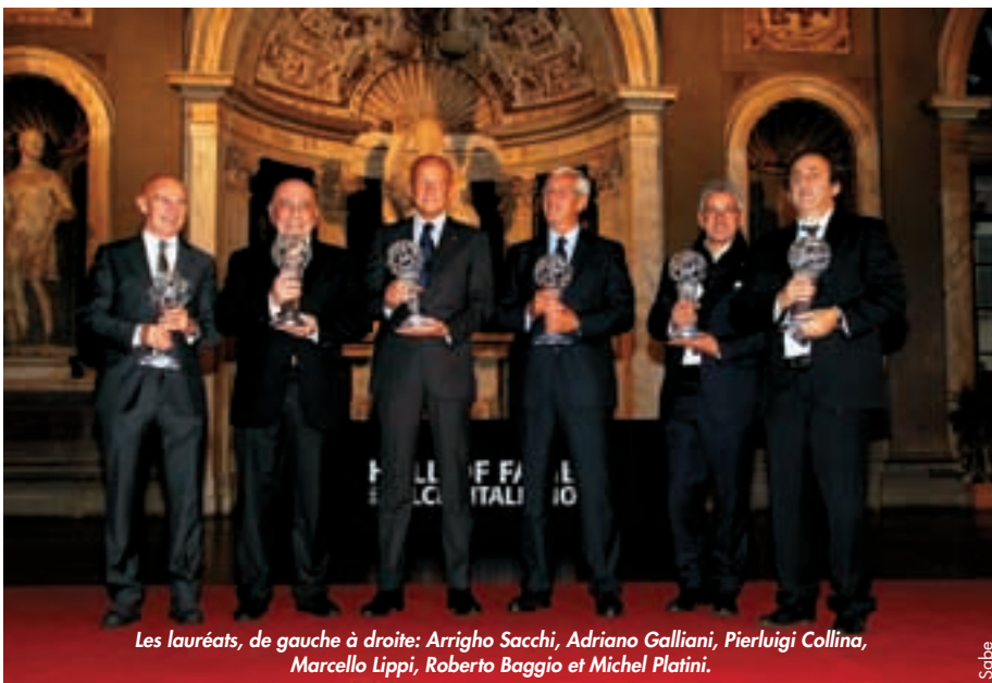
Les lauréats, de gauche à droite: Arrigo Sacchi, Adriano Galliani, Pierluigi Collina, Marcello Lippi, Roberto Baggio et Michel Platini.

Le nouvel entraîneur a ajouté: «Il y a une masse considérable de travail à accomplir, mais en avançant dans la bonne direction et avec la passion nécessaire, des progrès importants peuvent être réalisés. Le comité exécutif de l'association et son directeur général ont des projets clairs et m'ont confié la responsabilité de lancer le processus de rénovation dans une vue à long terme. Parallèlement, dans l'intérêt de tous, et en particulier de nos supporters, ma tâche consiste à travailler avec les joueurs pour garantir des performances compétitives tout au long de la compétition de qualification pour la Coupe du monde 2014.»