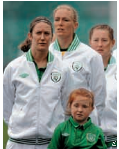
L'équipe féminine de République d'Irlande est bien placée dans son groupe de qualification de l'EURO féminin 2013.

La dernière qualification de l'équipe A de la République d'Irlande pour un tournoi international majeur remontait à dix ans mais maintenant, grâce à Giovanni Trapattoni et à son équipe, nous nous réjouissons de disputer l'EURO 2012 en Pologne et en Ukraine.