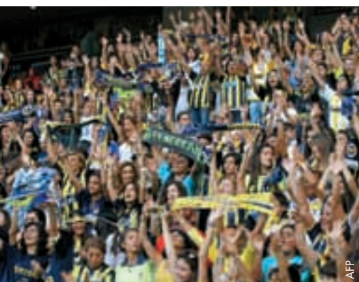
Des femmes et des enfants dans les stades turcs.

En septembre, le comité exécutif de l'Association turque de football (TFF) a décidé que les femmes et les enfants de moins de 16 ans