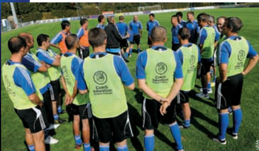
L'heure de la théorie pour les candidats à la licence Pro.

Trois événements similaires figurent dans le calendrier de l'UEFA pour la saison 2011-12. ●