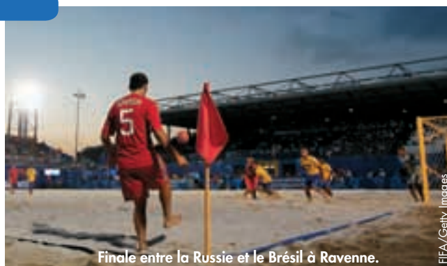
Finale entre la Russie et le Brésil à Ravenne.

L'Ukraine, qui ne s'est inclinée devant le Brésil qu'aux tirs au but en matches de groupe, et la Suisse complétaient la délégation européenne. ●