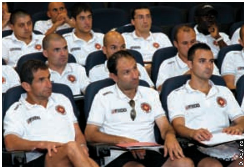
Les meilleurs arbitres maltais réunis en séminaire.