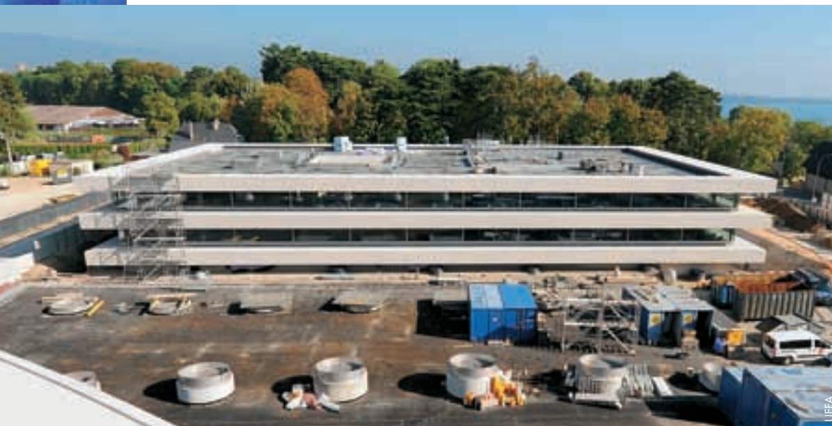
Le nouveau bâtiment administratif de l'UEFA, Bois-Bougy, pourra accueillir dès le printemps prochain 190 collaborateurs de l'administration de l'UEFA.

qui devait prendre fin en 2012. Ce sont ainsi, pour la nouvelle période, plus de 21 millions d'euros qui seront réservés pour l'arbitrage, le montant global comprenant une contribution annuelle de 100 000 euros pour chaque membre à part entière (75 000 pour le membre partiel) et un bonus de 100 000 euros versé au moment de la signature des nouveaux adhérents.