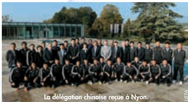
La délégation chinoise reçue à Nyon.

Sous la bannière de l'Année de la jeunesse Union européenne-Chine, l'UEFA a lancé, en collaboration avec la Commission européenne, un programme de formation pour de jeunes entraîneurs venus de Chine.