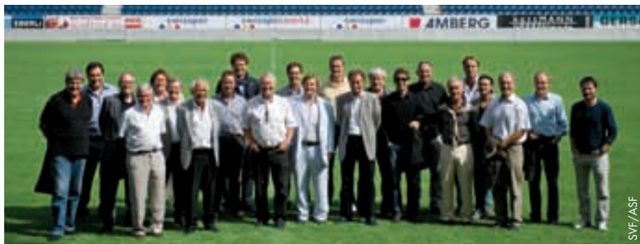
Les anciens internationaux à la Swissporarena.

Depuis des années, l'Association suisse de football (ASF) organise une excursion d'une journée pour ses anciens joueurs internationaux. Cet événement, qui est beaucoup apprécié, donne lieu à un riche échange de vues entre les anciens joueurs de l'équipe nationale.