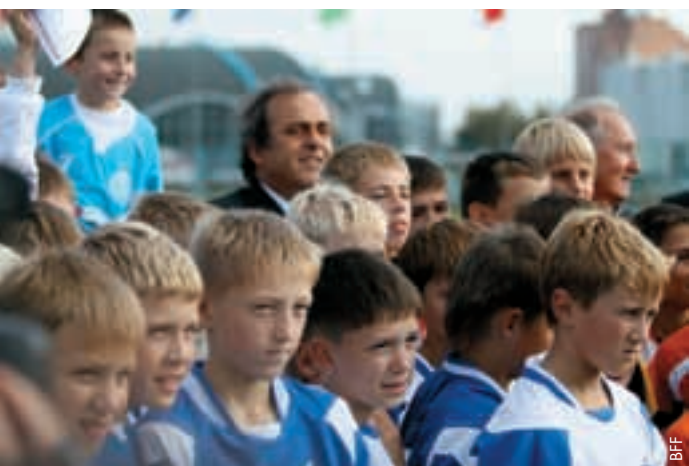
Michel Platini au milieu des jeunes footballeurs.