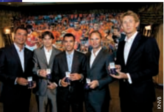
Les cinq nouveaux chevaliers. De gauche à droite: Giovanni van Bronckhorst, Phillip Cocu, Ruud Gullit, Frank de Boer et Edwin van der Sar.