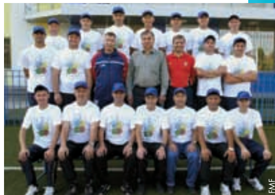
Les instructeurs entourés par les candidats à la licence C.

La Fédération moldave de football (FMF) poursuit son travail en vue d'améliorer le niveau des entraîneurs locaux. Le 16 e cours de licence C a ainsi commencé récemment au stade CSCT Buiucani, à Chisinau.