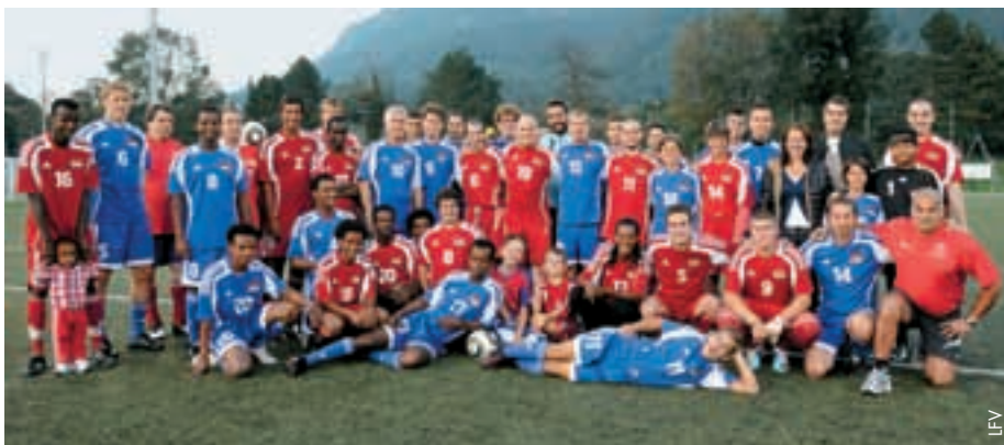
Une rencontre amicale pour la paix.

Les organisateurs ont pu une nouvelle fois se réjouir de cet événement parfaitement réussi, qui a constitué un signe important de paix, de tolérance, d'intégration et de rassemblement de tous les hommes. Cet événement a son origine dans les activités des Nations Unies, qui, dans une résolution de