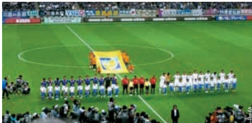
Un match Japon-Corée du Nord placé sous le signe du respect.