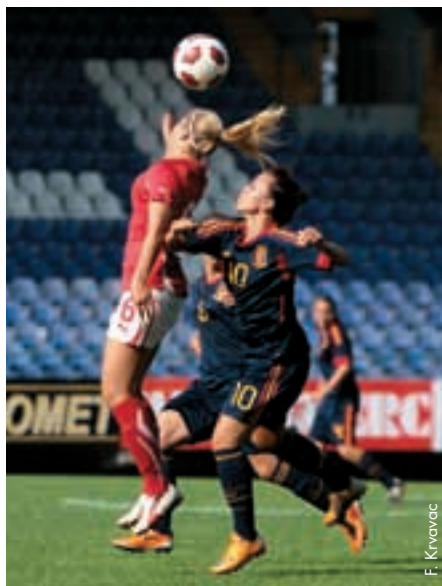
Rencontre entre l'Espagne et la Suisse, les deux qualifiés du tournoi M19 féminin joué en Bosnie-Herzégovine.