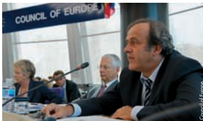
Michel Platini s'exprime devant le Conseil de l'Europe.

courager l'indispensable coopération entre autorités publiques et autorités sportives qui s'impose en la matière.»