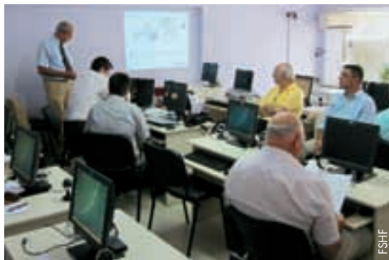
Des séminaires sont organisés pour faciliter l'introduction du nouveau système.

Une autre nouveauté apportée par le système est la possibilité pour les arbitres, les délégués et les observateurs de