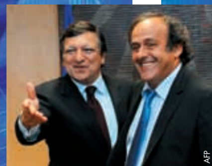
José Manuel Barroso et Michel Platini.

Enfin, Michel Platini a évoqué la promotion et le développement du football des équipes nationales, une question qui lui tient à cœur. José Manuel Barroso a reconnu que les équipes nationales reflètent les idées fondamentales de l'UE et que leur protection est essentielle pour un développement sain du football européen. ●