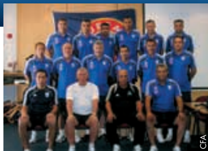
Les candidats à la licence Pro de l'UEFA.