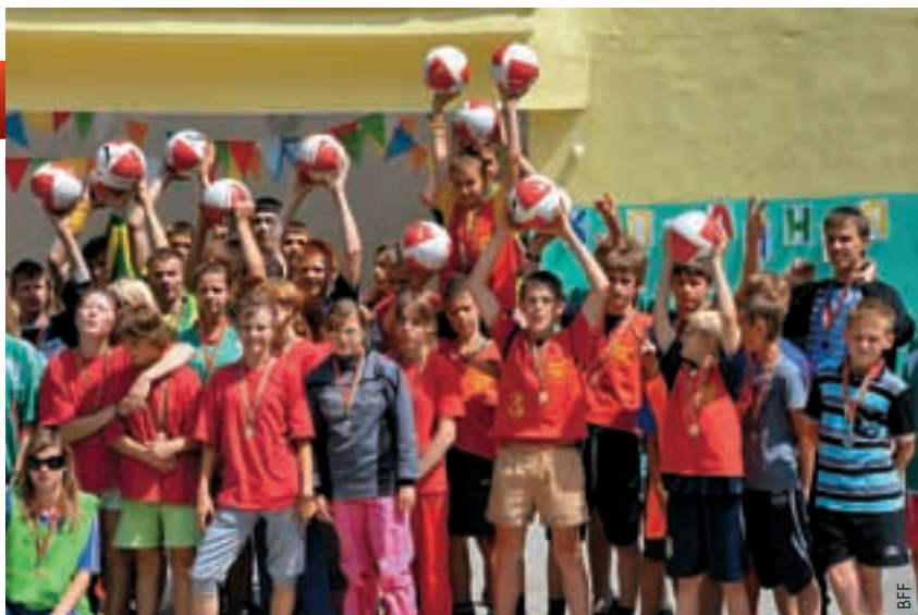
Beaucoup d'enthousiasme chez ces jeunes footballeurs !