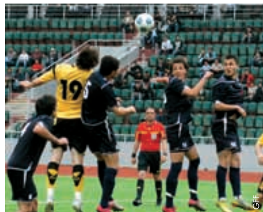
Une nouvelle formule pour le championnat national géorgien.