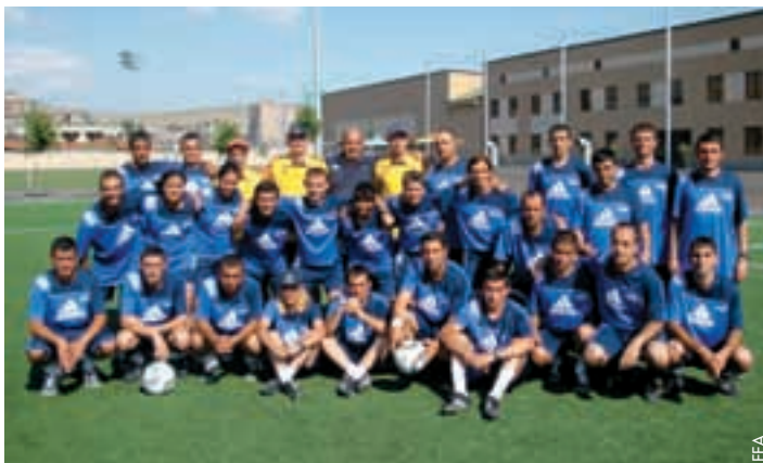
Les arbitres des deux plus hautes divisions réunis pour le cours.

«Ce cours est destiné au football junior. Notre objectif principal est de former des entraîneurs et de leur transmettre des méthodes d'entraînement adaptées à chaque catégorie