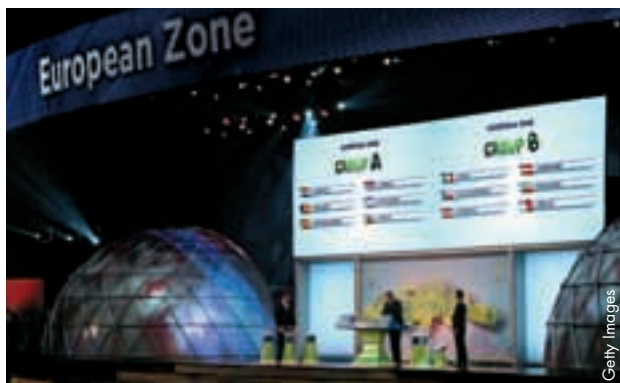
Le tirage au sort des groupes européens à Rio de Janeiro.

Les matches de qualification de l'EURO 2012 n'ont pas encore délivré leur verdict mais les équipes nationales européennes ont déjà des rêves pour de plus lointains horizons après le tirage au sort pour la formation des groupes de qualification de la Coupe du monde 2014, qui a été effectué le 30 juillet à Rio de Janeiro.