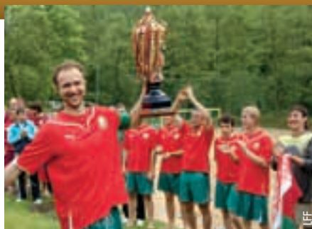
Le capitaine de l'équipe de Belarus brandit la trophée.

A l'occasion de la Coupe Belmontas, un nouveau terrain de football de plage a été inauguré,