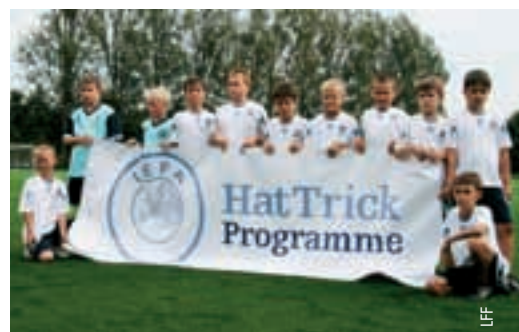
Le programme HatTrick de l'UEFA profitera aux jeunes joueurs lettons.