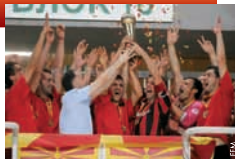
Le FC Shkendija a remporté la première Super Coupe d'ARY de Macédoine.

Le FC Shkendija était particulièrement heureux de cette victoire qui faisait de cette saison la plus fructueuse de son histoire. ● Zoran Nikolovski