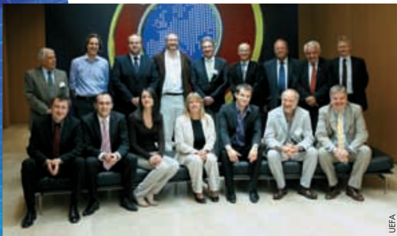
Le jury du Programme de bourses de recherche de l'UEFA et les quatre candidats de l'an dernier venus présenter leur travail.

Dans le cadre des initiatives lancées récemment par l'UEFA et visant la production de travaux de recherche qui aideront la famille du football européen dans son processus de prise de décisions, le Programme de bourses de recherche de l'UEFA soutient le travail doctoral et post-doctoral de chercheurs investigant sur le jeu en Europe.