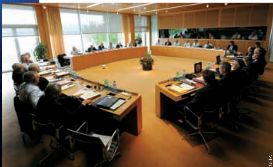
Le Comité exécutif pendant sa séance à Nyon.

En ce qui concerne le Championnat d'Europe M21 qui s'est joué cette année au Danemark, le Comité exécutif a approuvé la répartition financière pour les équipes participantes. Le vainqueur de la compétition