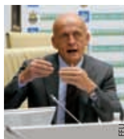
Pierluigi Collina s'adresse aux médias ukrainiens.