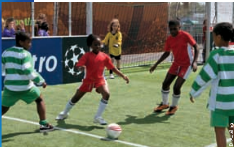
Les jeunes et le football de base ont été au cœur du festival.

L'entraîneur de l'équipe nationale, Hope Powell, a ajouté: «C'est fantastique. Mettre sur pied des manifestations spécifiquement consacrées au football féminin lui apporte du soutien et nous fournit une plate-forme. Il faut espérer que cela donnera envie aux jeunes filles de le pratiquer. Il est nécessaire de créer une base de joueuses et que celles-ci aient la possibilité de jouer. Premièrement,