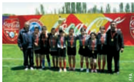
L'équipe d'Areni a remporté le tournoi.

La Fédération arménienne de football (FFA) a toujours soutenu les manifestations visant au développement et à la popularisation du football dans le pays.