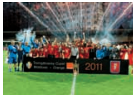
La Coupe de Moldavie pour le FC Iskra-Stal.