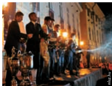
L'heure de la fête pour les joueurs de Videoton, reçus par la municipalité de Székesfehérvár.