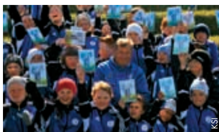
International islandais et joueur de Coventry, Aron Einar Gunnarsson a distribué des DVD aux enfants de Dalvík.