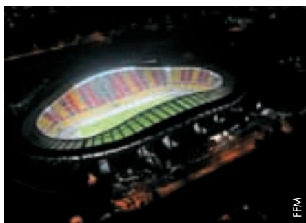
Le stade national Philippe II de Macédoine.