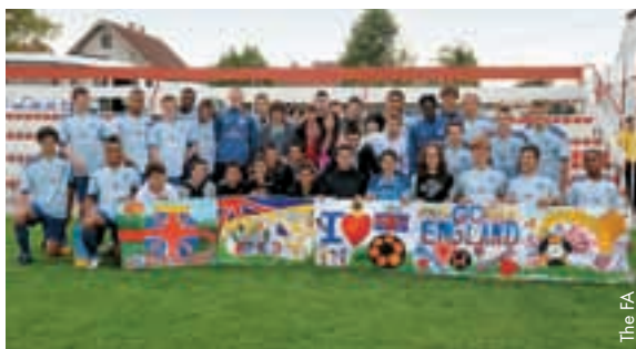
Les M17 anglais et leurs jeunes supporters serbes.