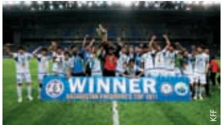
L'Azerbaïdjan a remporté le tournoi junior international.

La Coupe du président de la République du Kazakhstan s'est jouée à l'Astana Arena du 15 au 30 avril. Cette année, la Fédération kazakhe de football (KFF) avait décidé de changer la formule