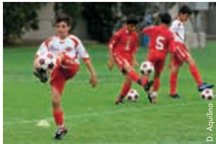
La MFA voue la plus grande attention au développement des jeunes footballeurs.