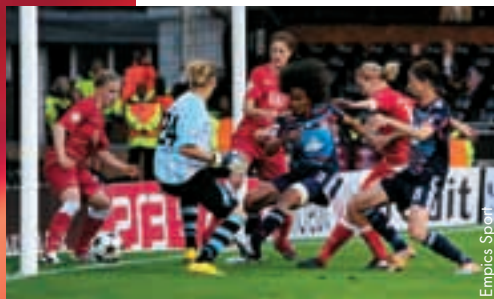
L'ouverture de la marque par Wendie Renard (3).

Lyon a effectué un parcours remarquable en éliminant de forts rivaux comme AZ Alkmaar et WFC Rossiyanka grâce à des succès à l'addition des deux matches respectivement de 10-1 et 11-1, après quoi les Françaises ont réglé le sort de Zvezda-2005 en quarts de finale, Lara Dickenmann faisant la différence au Stade de Gerland après un match nul sans but en Russie. Une foule de plus de