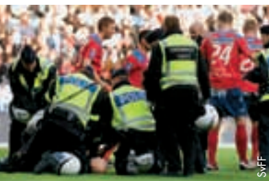
Intervention de la police à Malmö pour maîtriser un fan agressif; ce dernier risque une amende légère et une interdiction de stade d'une année.

La Fédération suédoise de football (SvFF) plaide, aux côtés du gouvernement, en faveur de mesures légales plus sévères contre le hooliganisme. Au début de la présente saison, deux matches de première division (Allvenskan) ont été arrêtés en raison de troubles au sein du public et de recours à des engins pyrotechniques illégaux. Des mesures disciplinaires à l'encontre des clubs impliqués n'ont pu éviter d'autres incidents.