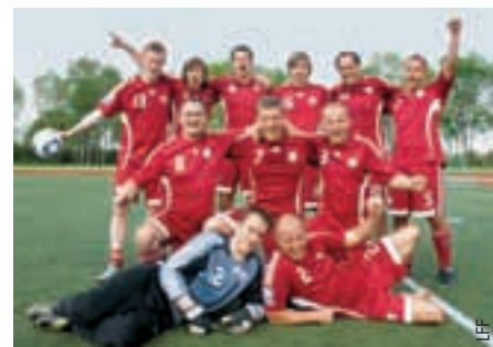
L'équipe des journalistes lettons s'est rendue pour la première fois à l'étranger.