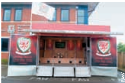
Un «vestiaire ambulant» pour promouvoir le football.