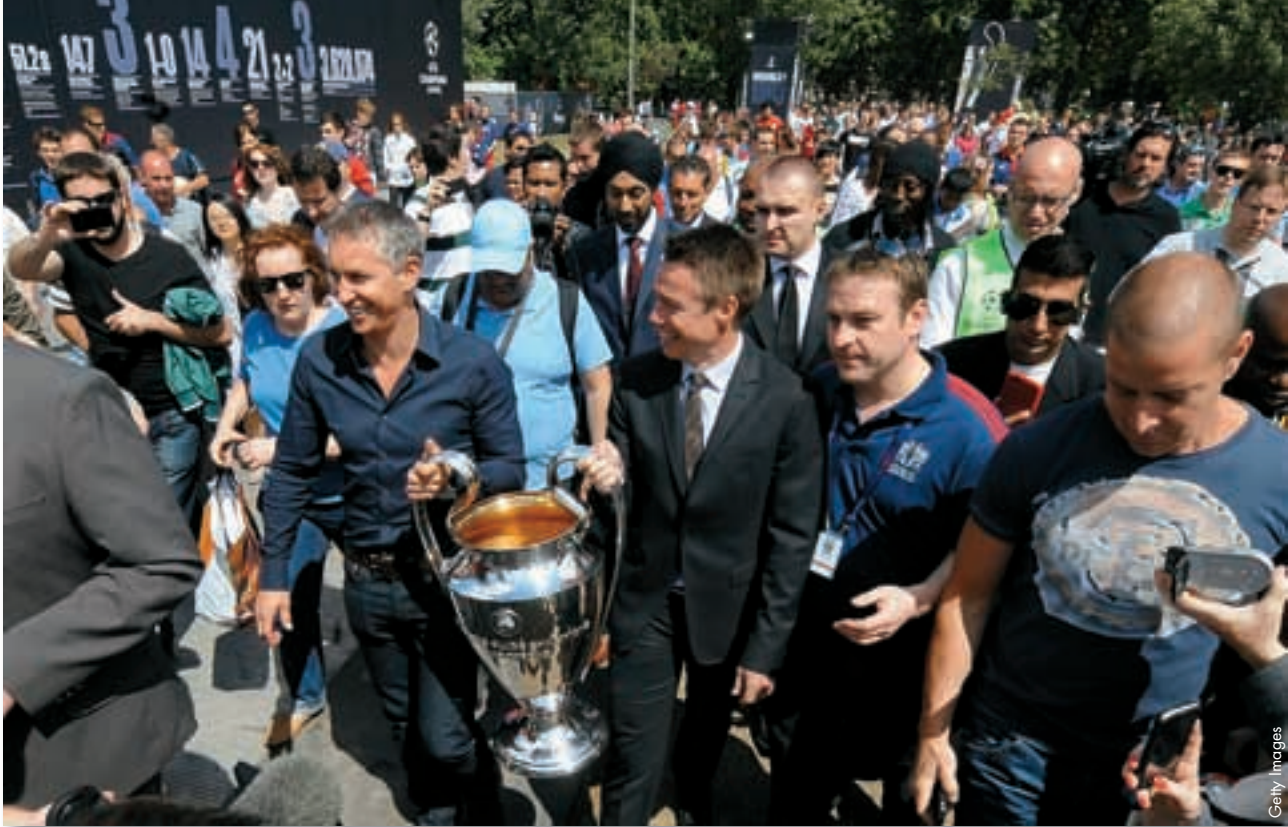
Bain de foule pour le trophée de la Ligue des champions porté par Gary Lineker et Graeme Le Saux.

cela nous donne davantage de joueuses parmi lesquelles nous pouvons faire notre choix et, deuxièmement, avec des aspects comme le programme du gouvernement sur l'obésité, cela incite à exercer une activité.»