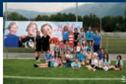
La fédération souhaite que davantage de jeunes filles pratiquent le football.

de sélection nationale et encore moins d'équipe nationale. Cela doit maintenant changer car avec sa campagne «Le ballon aux jeunes filles», le LFV entend d'abord renforcer la base pour avoir à moyen terme un potentiel suffisant pour l'élite. C'est ainsi que, récemment, toutes les filles en âge de fréquenter l'école primaire ont été invitées à participer à six entraînements de familiarisation pour humer sans engagement l'ambiance du football et adhérer peut-être ensuite à l'une des équipes de club existantes. Les entraînements de familiarisation ont eu lieu entre le 11 mai et le 1 er juin dans six communes et ont été placés sous la direction de Monika Zuppiger, directrice technique du football féminin au LFV. La campagne sera également soutenue sur le plan médiatique, par exemple via une action d'affichage et par