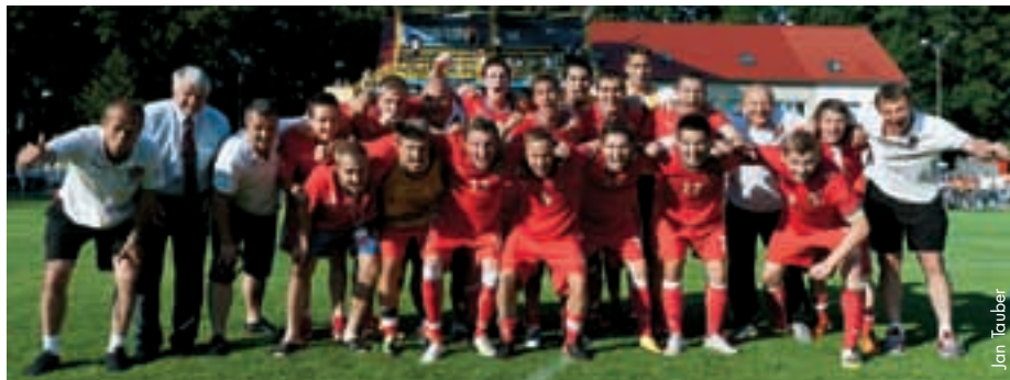
L'équipe nationale tchèque des moins de 19 ans.