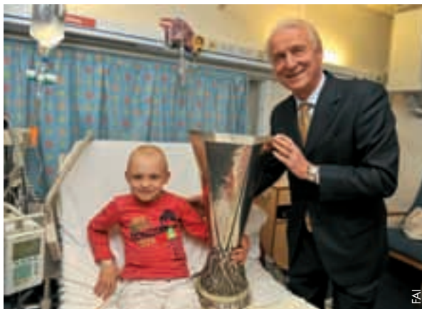
Giovanni Trapattoni fait découvrir le trophée de la Ligue Europa de l'UEFA à un enfant hospitalisé.