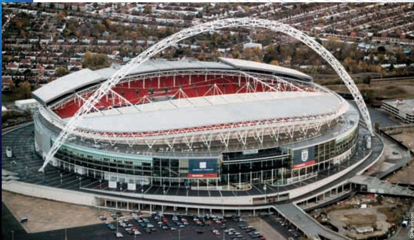
Le stade de Wembley et son arc caractéristique.

Depuis lors, bien sûr, l'endroit a été entièrement reconstruit. L'ancien stade de Wembley a été démoli en 2003, les deux tours jumelles ayant fait place à une arche stupéfiante qui s'élève loin au-dessus du stade. L'étourdissant nouveau terrain s'enorgueillit de posséder 90 000 places assises et a été inauguré en 2007. «Le nouveau Wembley est magnifique», estime l'ambassadeur 2011 de la Ligue des champions, Gary Lineker. «Gravir ces marches pour recevoir un trophée est sans