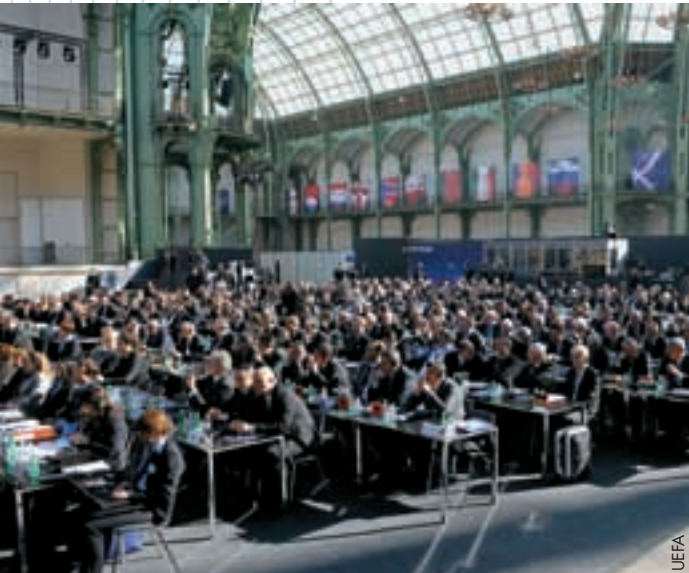
Les délégués des associations nationales.