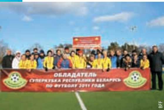
Bobruichanka, vainqueur de la Supercoupe féminine.

Le 26 mars, la Supercoupe féminine s'est disputée sur le terrain synthétique de SOK «Olimpiiskiy», opposant le vainqueur du championnat national, Bobruichanka, au vainqueur de la coupe, Zorka-BDU, également vice-champion. Ces équipes s'étaient déjà affrontées en novembre dans le cadre de la finale de la coupe.