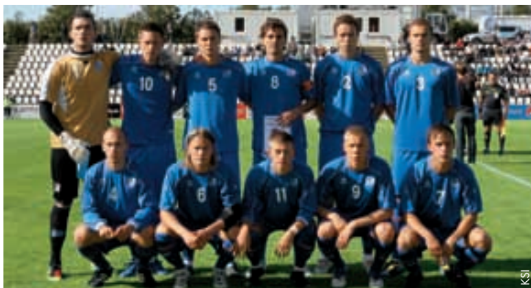
Les M21 islandais, prêts à participer au tour final au Danemark.