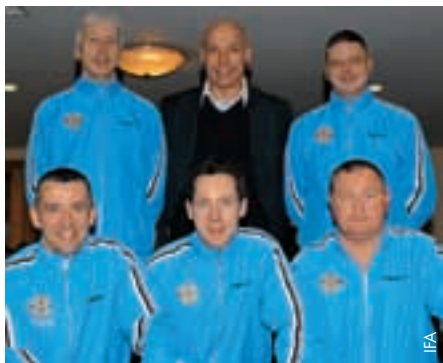
Howard Webb (au centre en haut) en compagnie d'arbitres nord-irlandais.

Webb. «Le monde de l'arbitrage a changé de manière spectaculaire ces dix dernières années et il est fantastique de voir la Fédération irlandaise prodiguer à ses arbitres tout ce soutien supplémentaire.»