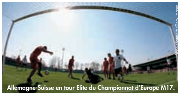
Allemagne-Suisse en tour Elite du Championnat d'Europe M17.

Cette phase finale déterminera également les participants européens à la prochaine Coupe du monde M17 qui aura lieu du 18 juin au 10 juillet au Mexique, les trois premiers de chaque groupe empochant leurs billets pour le Mexique. ●