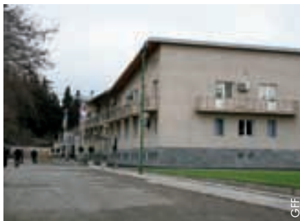
Le centre BASA.