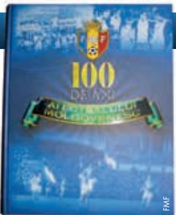
Le livre du centenaire publié par l'Association moldave.

Pour marquer le centenaire du football moldave, l'Association moldave de football a chargé le président de l'Association «Histoire et statistiques du football», Serghei Donets, de produire un livre sur l'histoire du football moldave. Une vingtaine de journalistes et de photographes ont participé à la réalisation de cet ouvrage de 575 pages. Après 339 pages sur l'histoire du football moldave, ses plus grands joueurs, ses dirigeants et son infrastructure, superbement illustrées par de nombreuses photos d'archives, le livre comprend une section de statistiques détaillées, avec les palmarès des vainqueurs des compétitions, des meilleurs buteurs de Moldavie et des joueurs de l'année,