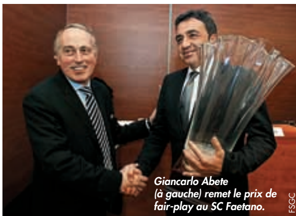
Giancarlo Abete (à gauche) remet le prix de fair-play au SC Faetano.