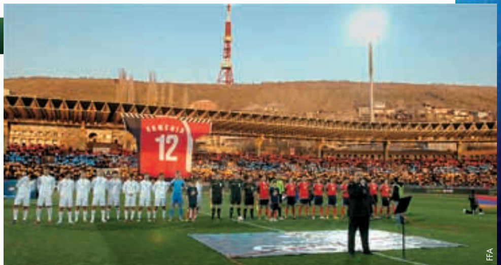
L'ambiance était chaleureuse pour le match entre l'Arménie et la Russie.

Entre-temps, l'équipe féminine d'Arménie a passé avec succès le tour préliminaire du Championnat d'Europe féminin 2013. Dans sa lutte contre les formations de Géorgie, des Îles Féroé et de Malte, notre équipe a remporté la première place et, dans le tour qualificatif, elle affrontera les équipes du Danemark, de la République tchèque, de l'Autriche et du Portugal.