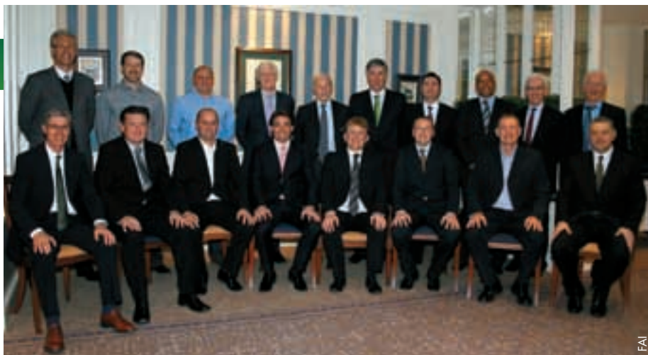
Les nouveaux entraîneurs diplômés Pro.