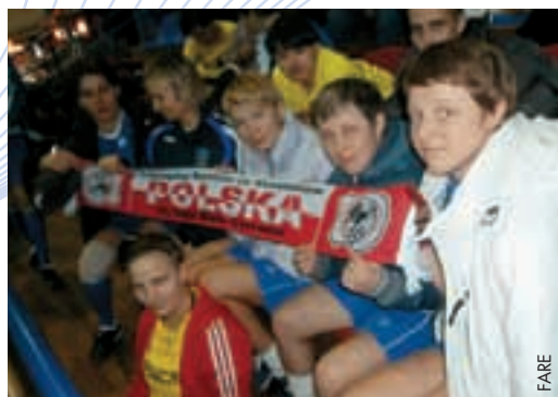
Les jeunes Polonaises lors du tournoi en Ukraine.

L'ambiance sur le terrain et dans les tribunes était très amicale durant ce tournoi. L'événement a permis de discuter de projets de lutte contre la discrimination. ●