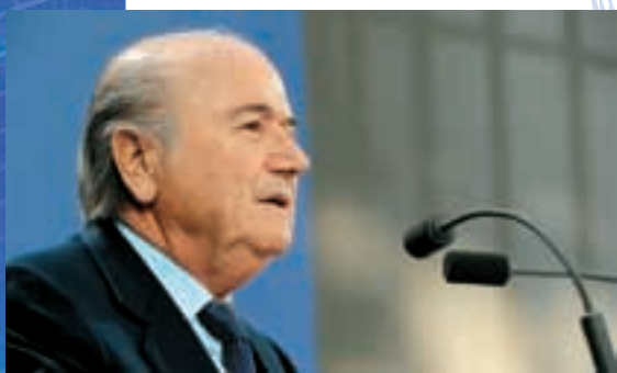
Joseph S. Blatter, Président de la FIFA.

Pour le Président de la FIFA, Joseph S. Blatter , les retrouvailles avec Paris sont toujours émouvantes puisque c'est dans cette ville qu'il a accédé, en 1998,