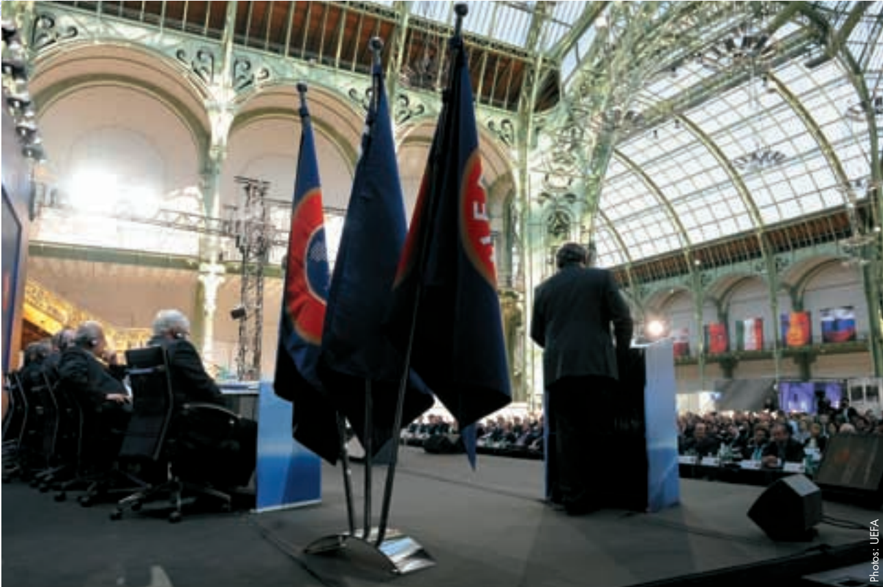
Michel Platini s'adresse aux congressistes après son élection.

Garantir l'universalité des compétitions était le troisième engagement, qui s'est traduit notamment par le passage à 24 participants pour l'EURO 2016 et la réforme de la liste d'accès à la Ligue des champions de l'UEFA ainsi que la transformation de la Coupe UEFA en Ligue Europa.