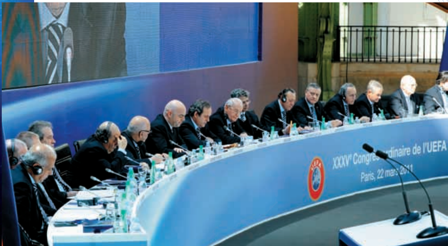
Le Comité exécutif au cours du Congrès.

Le deuxième engagement était d'accroître la solidarité et les échanges entre les fédérations, un objectif atteint grâce aux divers programmes d'échange et au développement du programme HatTrick grâce auquel «nous sommes passés (...) d'un total de 408 millions d'euros redistribués aux fédérations pour la période 2008-12 à un montant de près de 500 millions d'euros pour la période 2012-16.»