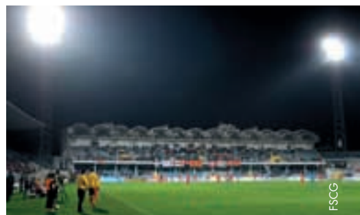
Le stade de Podgorica à la lumière de ses nouveaux projecteurs.

Les nouveaux projecteurs offrent une moyenne lumineuse de 1839 lux, une valeur supérieure à la norme de l'UEFA pour des stades de qua-