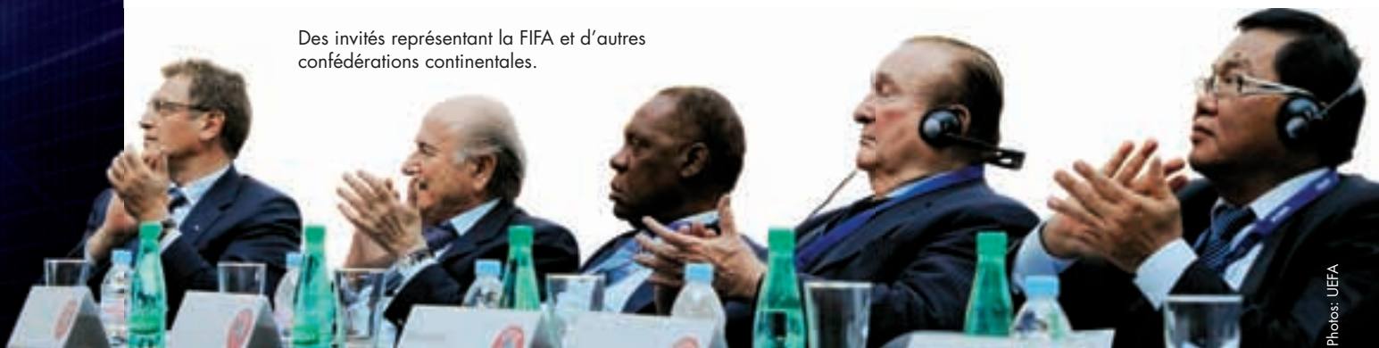
Des invités représentant la FIFA et d'autres confédérations continentales.

Par la voix de la ministre, Nicolas Sarkozy a assuré: «Vous avez choisi la France pour accueillir et organiser l'EURO 2016, la France sera à la hauteur de votre confiance et saura faire de cette compétition européenne un événement mondial. Les engagements pris seront tenus. Vous pouvez être assurés de mon engagement personnel sur ce point.»