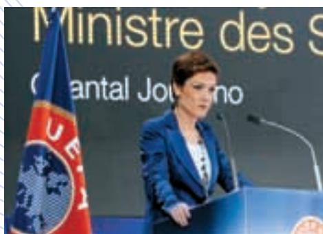
Chantal Jouanno, ministre des Sports de la République française.