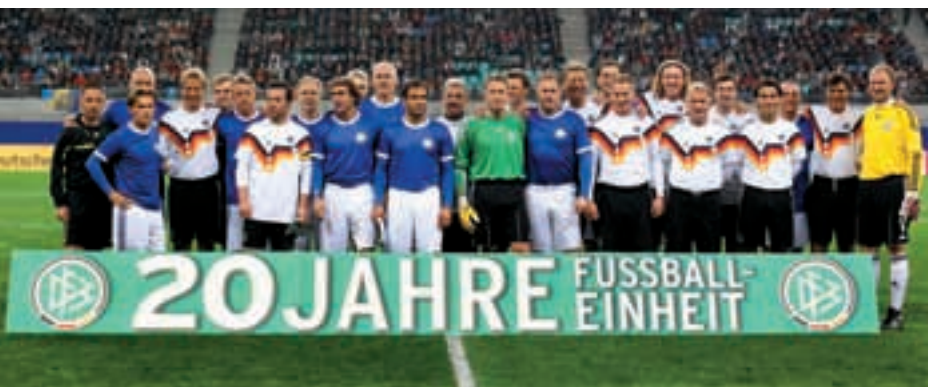
Match de gala entre anciens champions du monde et ex-internationaux de RDA.