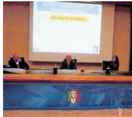
Arrigo Sacchi s'est prononcé pour un «football global».