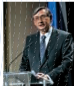
Danilo Türk, président de la République de Slovénie.

météorologiques ne permettant pas à son avion de décoller de Genève. Michel Platini a néanmoins fait savoir par un message vidéo envoyé via Internet qu'il était «de tout coeur avec la Slovénie.»