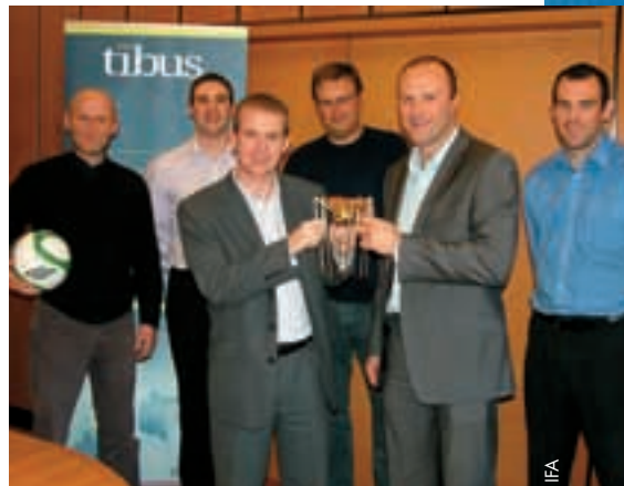
Un trophée apprécié pour le site de la Fédération nord-irlandaise de football.

Le nouveau site fournit beaucoup plus d'éléments en ce qui concerne le contenu vidéo et l'intégration de différents sites de réseaux sociaux en ligne mais il conserve toujours un contenu portant sur les principaux éléments de notre sport, à savoir le football international et national ainsi que le football de base. Par ailleurs, la boutique en ligne utilise dorénavant les plus récents outils du commerce électronique qui améliorent le confort de l'utilisateur.