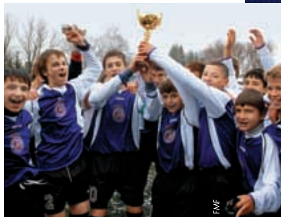
L'équipe de l'Est, gagnante du tournoi.