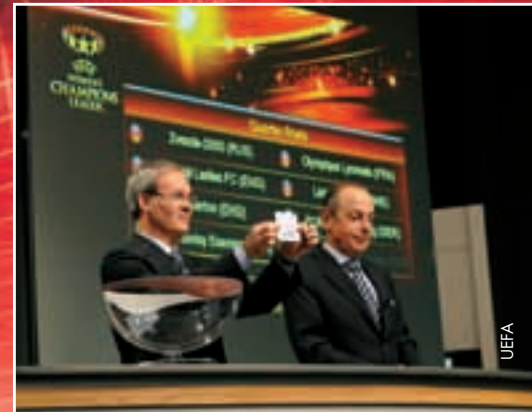
Tirage au sort des quarts de finale à Nyon.

Les matches aller auront lieu les 9-10 avril, les matches retour, les 16-17 avril. La finale se jouera à Londres le 26 mai, au Craven Cottage de Fulham. ●