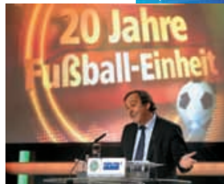
Les vœux de Michel Platini, assortis de souvenirs personnels.

blancs, parfois bleus et nous avons perdu la plupart du temps», a reconnu Michel Platini. Ce n'est toutefois pas la raison pour laquelle il s'est aussi beaucoup réjoui de la réunification politique et footballistique des deux Etats allemands. «Grâce à la réunification, les gens en Allemagne et en Europe ont accédé à davantage de liberté. Et cette liberté est le bien le plus important dans notre société et dans le football», a déclaré le président de l'UEFA. En allemand bien sûr !