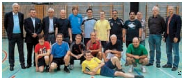
Les arbitres du Liechtenstein réunis pour un cours.