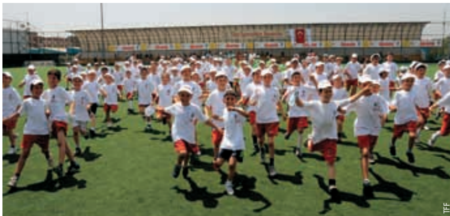
Du football pour tous, dans tout le pays.

Ersun Yanal, directeur général du football de la TFF, a déclaré: «Avec les activités de football de base «Football pour tous», nous visons à diversifier le football et à accroître le nombre de personnes qui pratiquent ce sport. Nous encourageons nos compatriotes à pratiquer un sport à chaque endroit et dans chaque situation avec les projets de football de base. En même temps, nous contribuons à créer une «culture sportive» plus efficace. Le développement des enfants à côté du football est également très important. Pour cette raison, nous étudions la possibilité de développer les ligues actuelles et d'en créer de nouvelles. En particulier, nous désirons que les jeunes filles turques participent à ce sport. Nous désirons obtenir une quatrième étoile afin de développer sainement le football féminin en Turquie.» ● Service de communication de la TFF