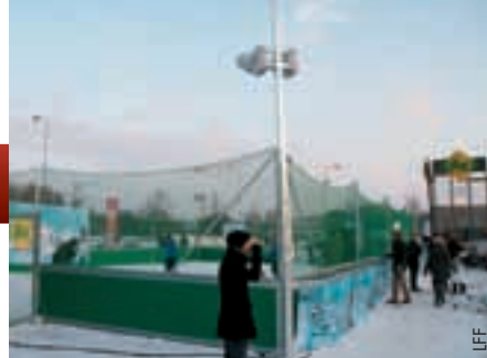
Un football d'hiver festif qui rappelle le football de plage.

En ce qui concerne les autres nouvelles, la LFF est arrivée au terme de son partenariat de cinq ans avec le plus grand prestataire de téléphone mobile du pays, Latvijas Mobilais