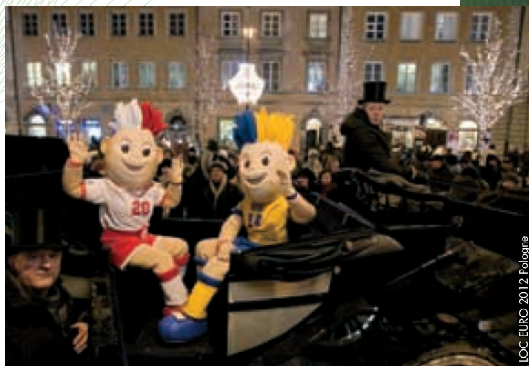
Ambiance de fête et transport particulier pour Slavek et Slavko.

A chaque étape de ce circuit, les gens ont voté afin de donner des noms pour la paire, Slavek et Slavko s'avérant les plus populaires (56%), suivis de Siemko et Strimko (29%) puis de Klemek et Lądko (15%). Au total, 39 233 supporters se sont exprimés, dont 8 424 en ligne sur UEFA.com. Les noms gagnants ont été révélés par Frantisek Laurinec, membre du Comité exécutif de l'UEFA, le 4 décembre à Kiev. «Les mascottes assurent la promotion des pays hôtes de manière très positive», a-t-il déclaré. «Elles sont jeunes et dynamiques, exactement comme l'Ukraine et la Pologne.» ●