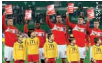
Les internationaux autrichiens disent non au racisme.

Mais, outre l'aspect sportif, d'intéressantes et importantes initiatives ont retenu l'attention au cours de cette soirée. C'est ainsi qu'ont commencé avec ce match international les deuxièmes semaines phares de «Vague contre la violence», le programme de prévention du ministère fédéral de l'Intérieur et de la Bundesliga autrichienne de football et de ses clubs en cours depuis juillet 2009 en vue d'enrayer la violence dans le football. En outre, la Fédération autrichienne de football (ÖFB) a lancé, dans le cadre de ce match international, une action de fair-play en faveur de la diversité et contre le racisme – en même temps que l'initiative «Fair-play. Beaucoup de couleurs, un jeu». Avant le coup d'envoi, les deux équipes ont manifesté leur désapprobation face à la discrimination et à l'exclusion. Lors de la présentation des équipes, les joueurs ont brandi des cartons rouges portant l'inscription «Carton rouge au racisme». Devant les équipes, des enfants ont déployé une banderole avec le message «Le football contre le racisme».