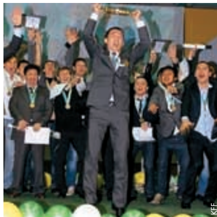
Premier titre de champion national pour le FC Kostanay Tobol.

remportée par le FC Aktobe qui a terminé à un point de Tobol. Quant à la médaille de bronze, elle est revenue au FC Pavlodar Irtysh.