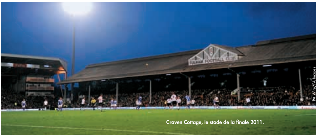
Craven Cottage, le stade de la finale 2011.