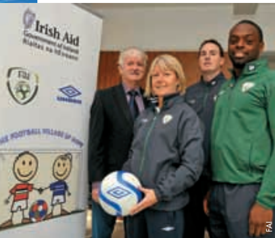
Les représentants de la FAI au Village de l'espoir.

et écoles de sports». Ce programme a été mis en place ces huit dernières années par le Centre Peres pour la paix. Le Village de football de l'espoir a été installé dans le village de Shfeya, dans le nord d'Israël, pour la troisième année de rang pendant la première semaine de décembre.