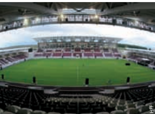
Le nouveau stade de Larissa.