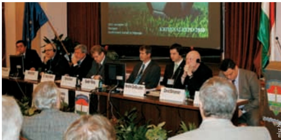
La Hongrie est déterminée à combattre le hooliganisme.