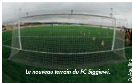
Le nouveau terrain du FC Siggiewi.