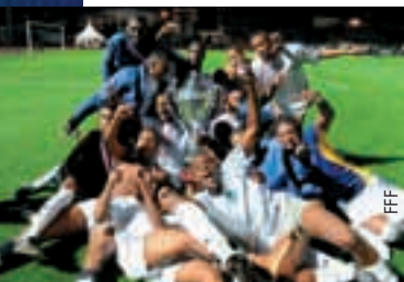
La Martinique a remporté la Coupe de l'Outre-mer.