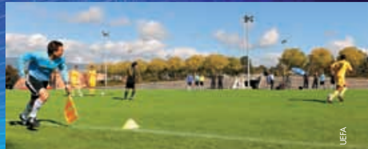
Séance d'entraînement à Colovray.

«Je suis très heureux d'être à Nyon. Je prends du plaisir, tout particulièrement dans les séances d'entraînement. Tout est très professionnel – c'est parfait. Et ce fut une formidable surprise que de rencontrer le président de l'UEFA!» ●