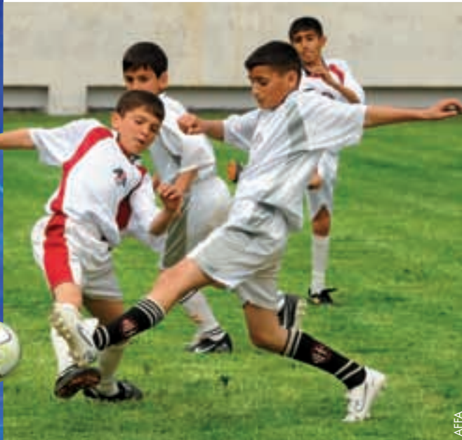
Football de base en Azerbaïdjan.

jan, le Luxembourg, Malte et la Turquie obtiennent trois étoiles, Andorre passe à quatre et l'Arménie ainsi que la République d'Irlande ont dorénavant cinq étoiles.