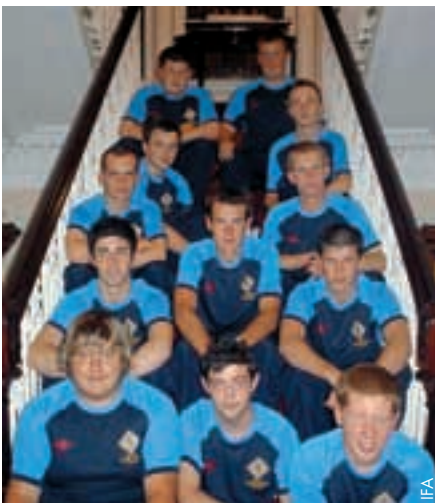
Un programme de valeur pour les jeunes arbitres.