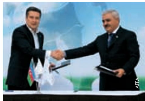
Le président de l'AFFA, Rovnag Abdullayev (à droite) vient de conclure un nouvel accord de partenariat.