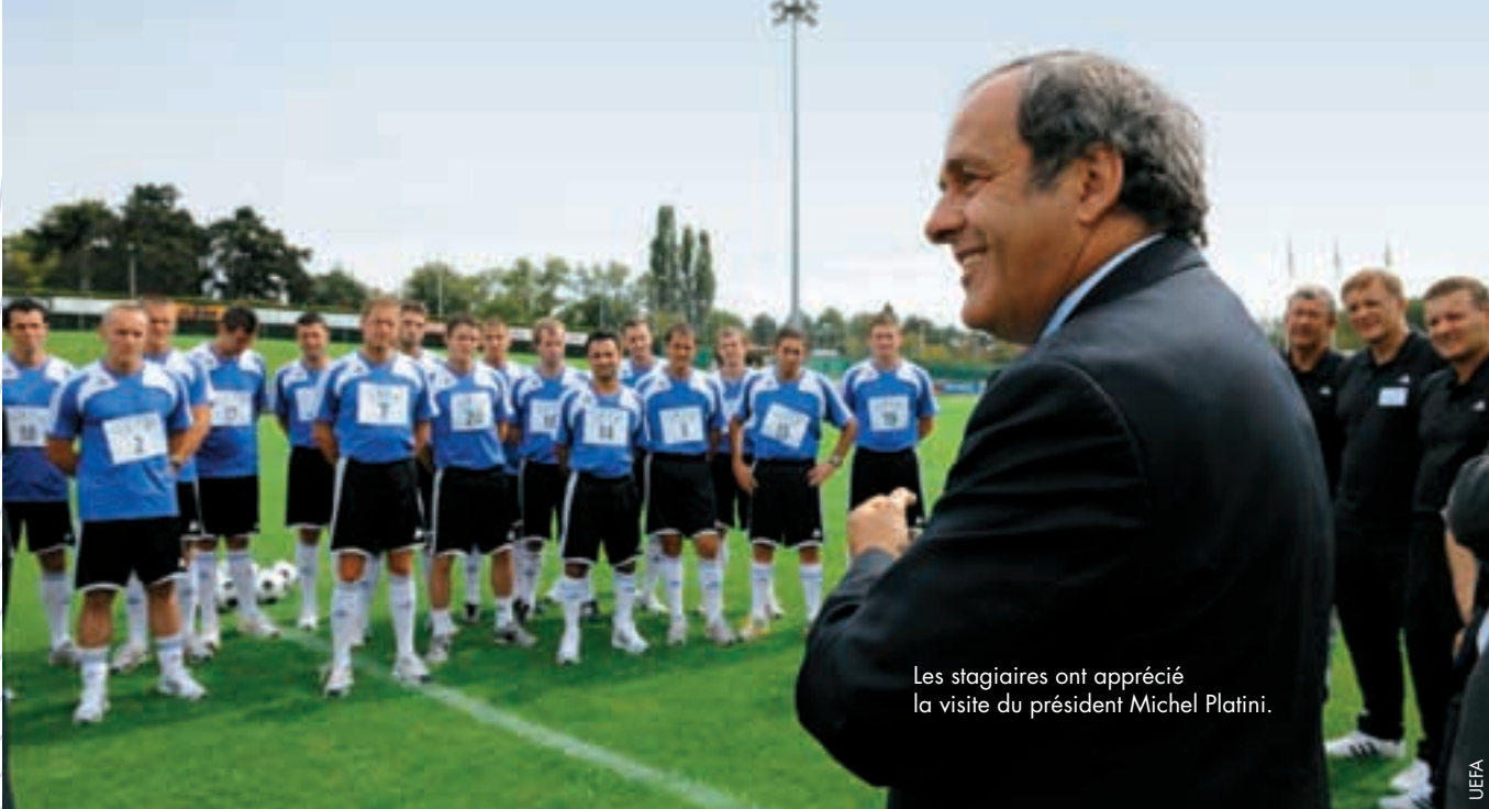
Les stagiaires ont apprécié la visite du président Michel Platini.