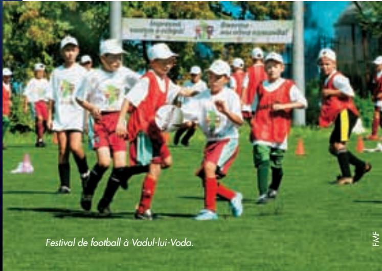
Festival de football à Vadul-lui-Voda.