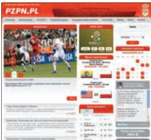
La page d'accueil du nouveau site de la Fédération polonaise.