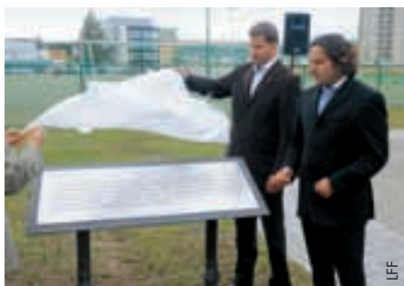
Le maire de Kaunas, Andrius Kupcinkas, et le président de la LFF, Liutauras Varanavicius, inaugurent le monument commémoratif.

Commencé il y a dix ans par un petit bâtiment et un seul terrain d'entraînement, le centre de formation national est maintenant le terrain d'entraînement le plus grand et le plus connu