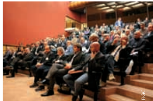
Le développement des talents a réuni un large auditoire.

Ce fut la première – mais certainement pas la dernière – initiative de ce genre, si l'on considère la présence de presque tous les clubs, ce qui marque un tournant dans notre football. Les débats ont été précédés d'une rencontre entre Arrigo Sacchi et les entraîneurs des équipes nationales juniors, qui ont ensuite rejoint les autres acteurs de la journée dans l'Aula Magna