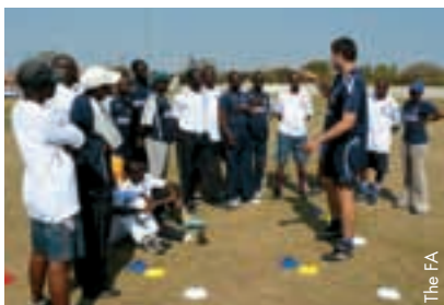
Des élèves très réceptifs.

Ces deux dernières années, le département de marketing et de publicité de la Fédération de football d'Azerbaïdjan (AFFA) a fait un grand pas en avant en matière de popularisation du football au niveau national. Le département organise régulièrement des «Festivals du ballon» pour les jeunes de 14 ans dans les différentes régions du pays, permettant ainsi à l'AFFA de découvrir de jeunes joueurs talentueux. En outre, le département a ouvert un magasin où les supporters peuvent acheter des articles de l'équipe nationale et a installé des boutiques de souvenirs dans les stades accueillant des matches des compétitions internationales et des matches amicaux. En 2009, l'asso-