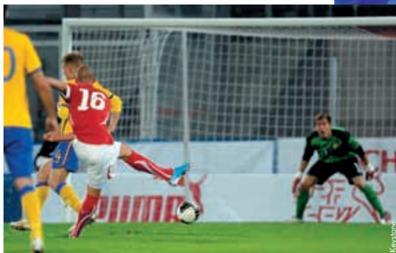
La Suisse a obtenu sa qualification pour le tournoi final des M21 en battant la Suède.