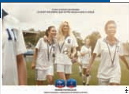
Une campagne de charme pour promouvoir le football féminin.

Des kits de promotion composés de posters, d'autocollants, de cartes postales et d'un panneau grandeur nature de l'ambassadrice ont été distribués aux clubs de D1 et D2 féminines,