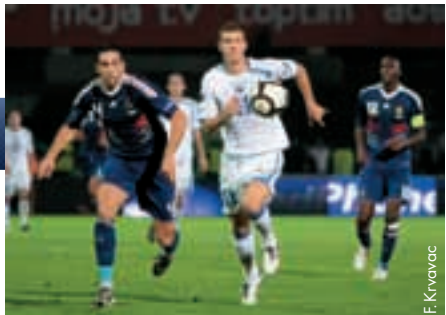
L'équipe de Bosnie-Herzégovine a offert une belle résistance à la France dans son deuxième match de qualification de l'EURO 2012.

L'équipe nationale des moins de 21 ans a terminé le tour qualificatif de son EURO 2011 au Danemark. Dans ses deux derniers matches, elle a perdu au stade Grbavica contre l'Italie (0-1) et a obtenu à Budapest le match nul contre la Hongrie (0-0). Finalement, elle a terminé au quatrième rang du groupe 3 avec deux succès, deux matches nuls et quatre défaites et une différence de buts de 4-8, derrière l'Italie, le Pays de Galles, la Hongrie et devant le Luxembourg. On s'attendait à un meilleur classement et à un