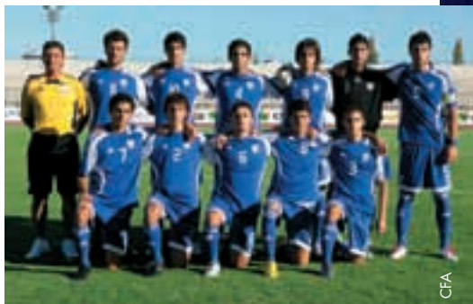
L'équipe nationale chypriote des moins de 17 ans.

Notre site Internet, qui est devenu public depuis août 2009, s'est enrichi d'une version anglaise avec des informations concernant nos équipes nationales et les compétitions nationales. ● Kyriakos Giorgallis