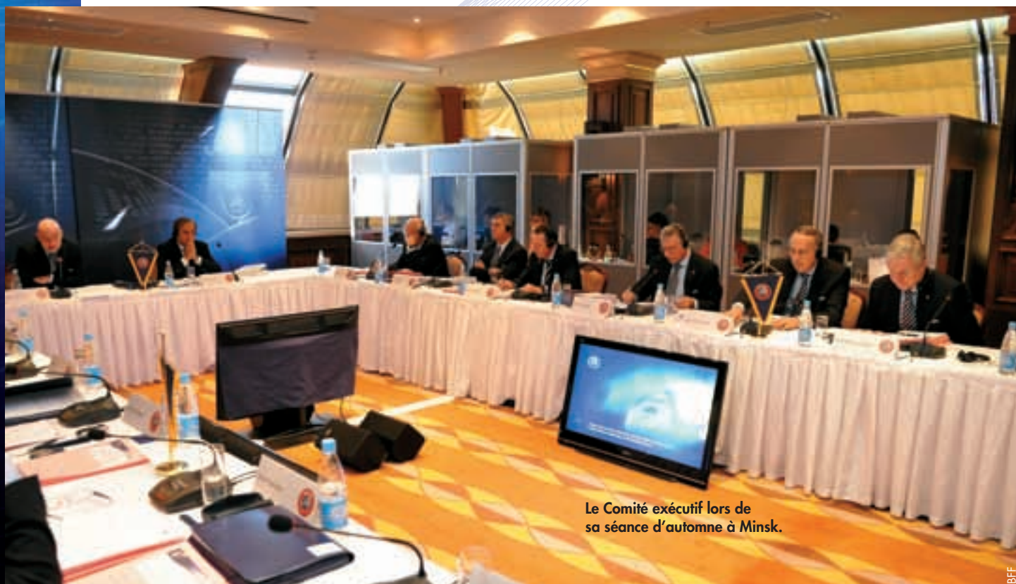
Le Comité exécutif lors de sa séance d'automne à Minsk.

Dans les compétitions interclubs, la principale nouveauté concerne la Ligue Europa de l'UEFA: dès la saison 2012-13, cette compétition comptera, comme